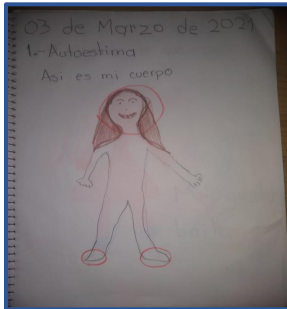
Foto 3. Reconozco mis características y habilidades. Los padres de familia son quienes les han permitido a los niños identificar cuáles son las características físicas emocionales que tienen y que son importantes expresar para irse reconociendo poco a poco.

tanto se les incentiva para que logren hacer lo que tanto se les dificulta como parte de los retos que pueden enfrentar en la vida.