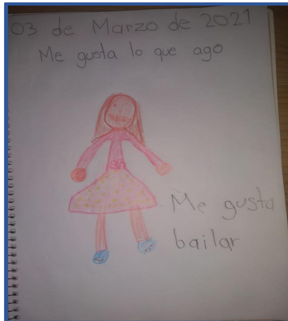
Foto 2. Lo que me gusta y puedo hacer. Les permite identificar a los niños sus gustos y organizar qué es lo que pueden hacer y lo que no pueden hacer por lo