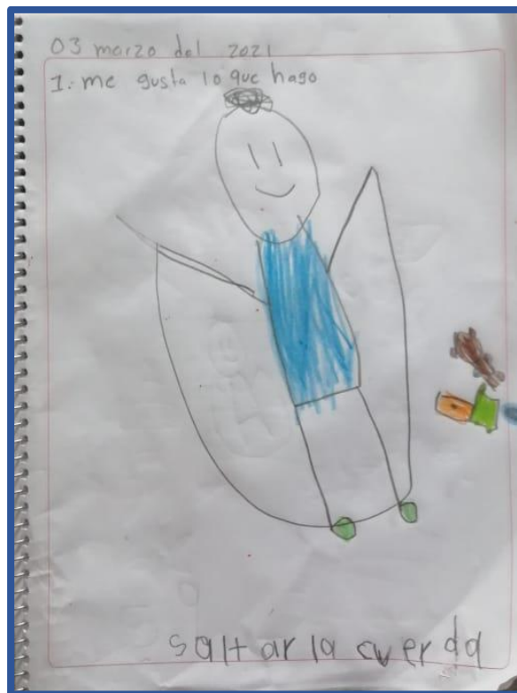
Foto 6. Lo que me agrada y puedo hacer. para que ellos se sientan bien consigo mismos y satisfechos del ambiente que les rodea es importante permitirles que hagan las cosas de forma libre siempre con la vigilancia de algún adulto, en esta ilustración podemos ver cómo el niño realiza su dibujo cuando salta la cuerda y se divierte mucho.

vida entre sus compañeros así es como la importancia de que ellos mismos aprendan a regular sus emociones por sí mismos sin tener que depender de los demás.