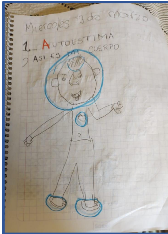
Foto 5. Reconocimiento de mi mismo mediante la exploración de mis características físicas. Ellos se identifican con la parte de su cuerpo en esta foto podemos ver como recalca la importancia de tener una buena actitud a través de sus expresiones faciales, de su mente y su corazón a través de la psicomotricidad como todo van vinculando.

Foto 4. Las cosas que puedo hacer con mi cuerpo. Por ejemplo aquí los niños muestran que les gusta correr saltar y les gusta el color azul lo reflejan a través de los dibujos que ellos mismos van ilustrando.