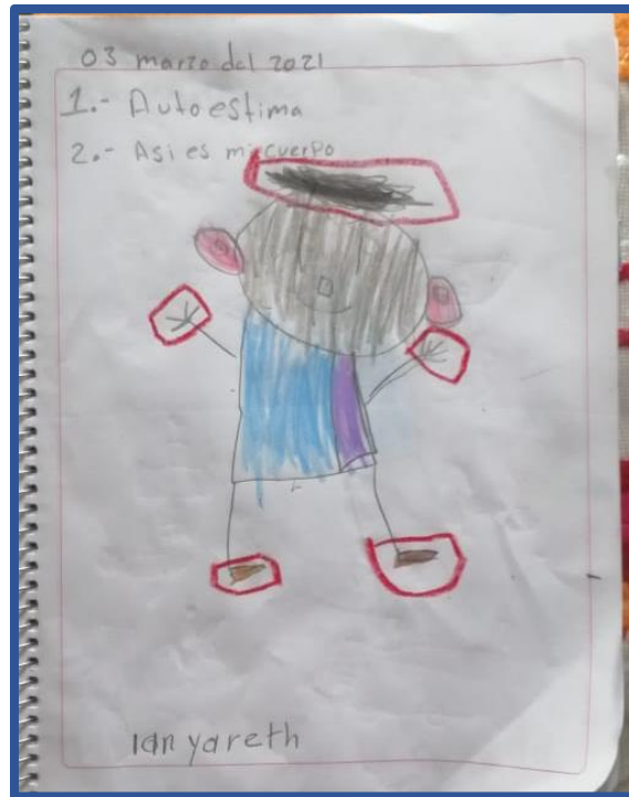
Foto 1. Se realizó la actividad Soy único y especial por mis características físicas y habilidades.