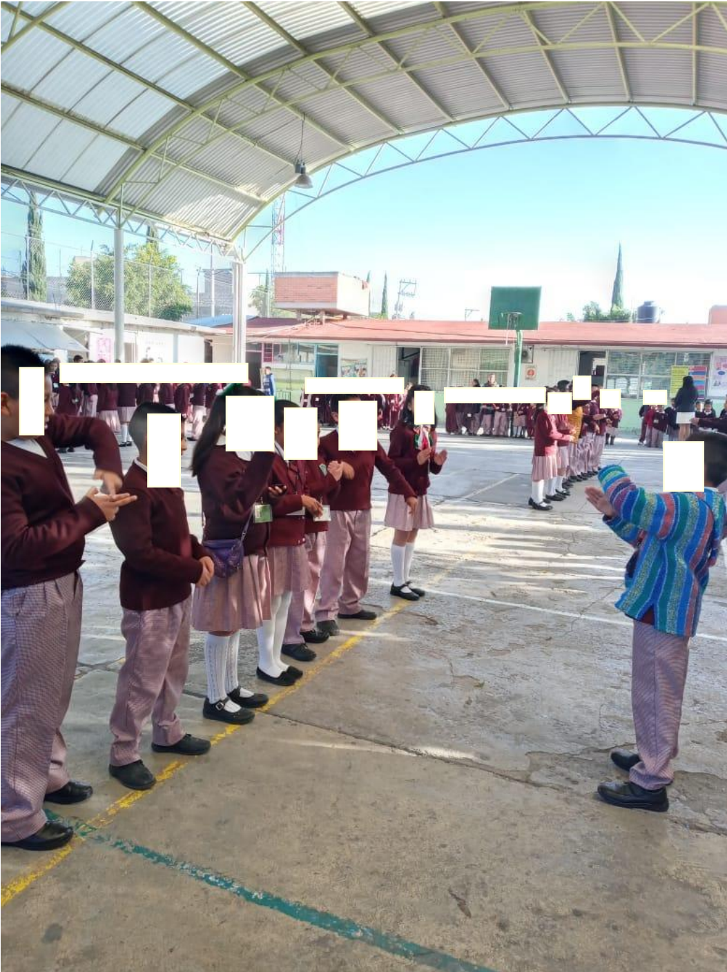
Uso de la Lengua de Señas Mexicana (himno Nacional Mexicano)