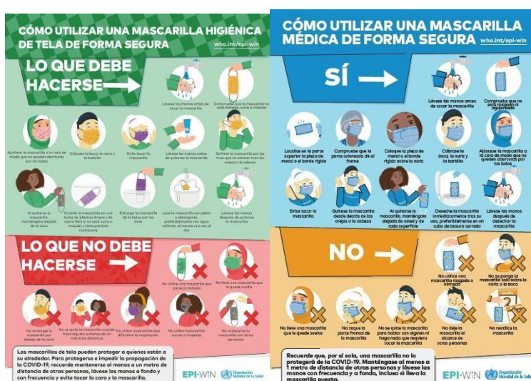
Uso correcto de mascarilla, obtenido de: https://salud.edomex.gob.mx/salud/covid