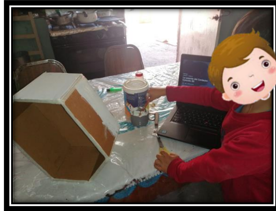
Reciclando con cartón