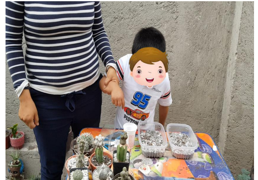
Evidencia de trabajo. Fotografía original