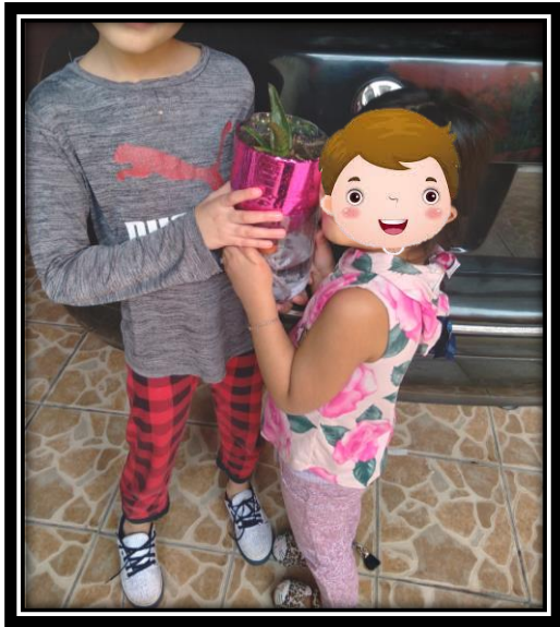
PLANTA DE AUTORRIEGO