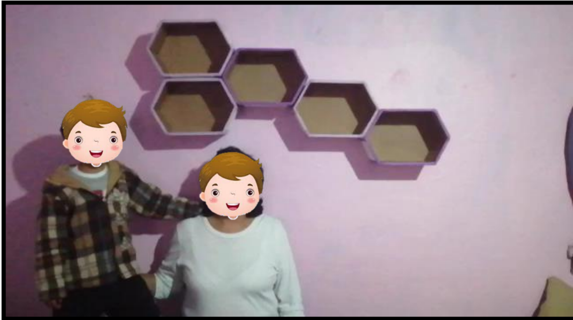
Evidencia de trabajo. Fotografía original