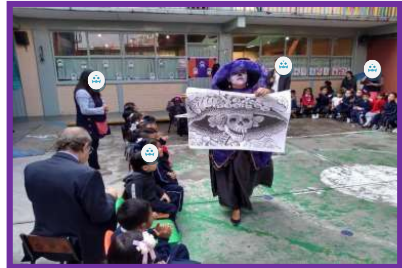
Vida y obra de “José Guadalupe Posadas”