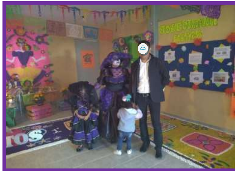
Ofrenda José Guadalupe Posadas