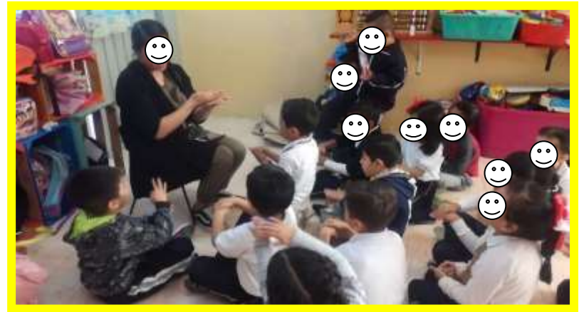
Lenguaje se de señas