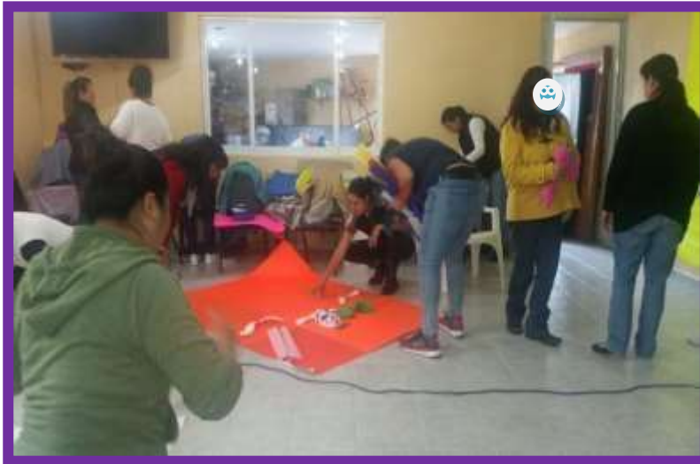
Taller “Elaboración de catrinas”