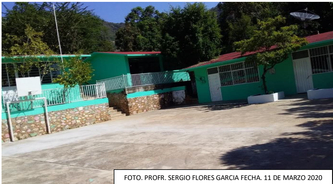
FECHA. 11 DE MARZO 2020