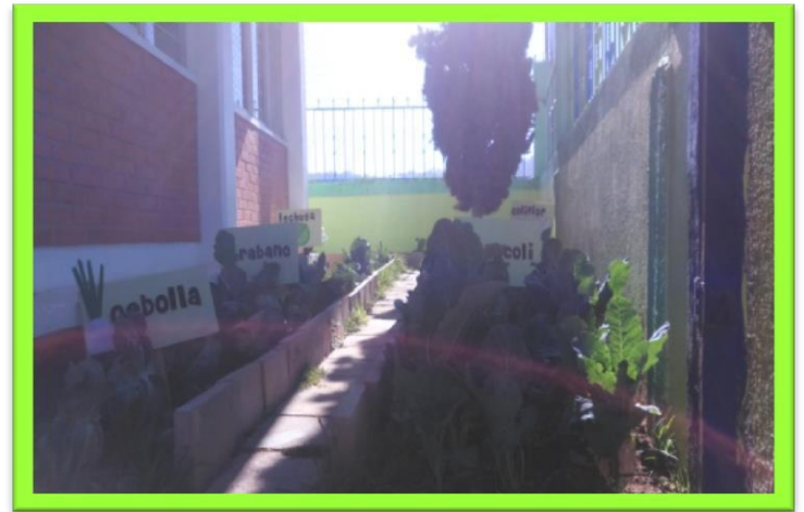
Evidencia, fotografía original

colocamos en el área de siembra que le correspondía a cada hortaliza.