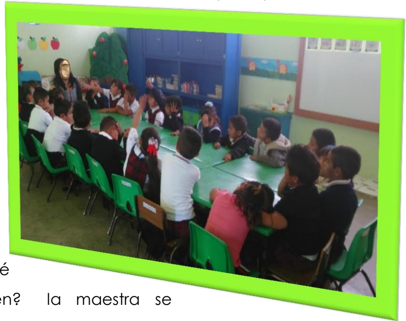
Evidencia, fotografía original

¿Qué creen? la maestra se sentó a platicar con nosotros y dice que la ONU, es una organización de muchos países, que quiere lograr un mundo más feliz y saludable para el año 2030, para entonces ya vamos a estar muy, muy grandes, nosotros nos comprometimos ayudando desde nuestro mundito, invitando a participar en mejorar, que el pueblo tenga un desarrollo sustentable (Preescolar, 2004, págs. 37-50) y podemos sembrar ricas verduras, que cuando crezcan, las vamos a comer, porque cada pequeña participación, significa mucho para el planeta, ¿Cómo? a pues al hablar con las familias y amigos sobre las acciones que pondremos en práctica desde casa.