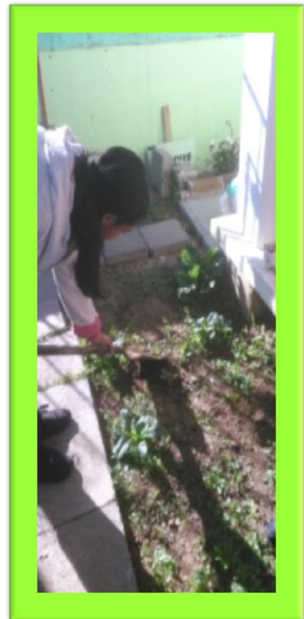
Evidencia, fotografía original

¡Cada día salimos a regar el huerto y no podíamos olvidar hacerlo, aunque al club sólo acudíamos dos veces a la semana, junto con la maestra acordamos los días en que cada compañero participaría, ahhh! Se nos olvidaba decirles que regábamos en la hora del recreo, pues el agua es muy importante para que las semillas germinen, es decir que de las semillas vaya saliendo una plantita, eso ¡fue increíble!, cada día observamos cómo iban creciendo todas las hortalizas y en nuestro cuaderno íbamos registrando con dibujos.