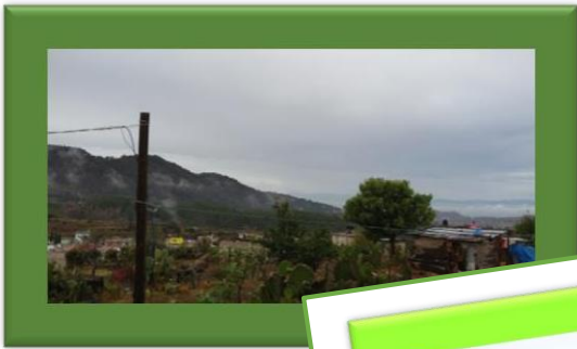
Contexto, fotografía original

¡Imagínate!, ¡Hasta las nubes entran a la casa! y otras veces llueve tanto, como una tormenta, ¡ Pareciera que se te va a caer el cielo!. Este pueblito se llama... se llama.... ¡ah! Sí, se llama San Juan Totolapan y dicen los abuelitos que en Náhuatl, ¿Náhuatl? Sí, es que antes así hablaban, entonces Totolapan es ¡Orilla del río donde abundan los guajolotes!, por cierto... ya no hay tantos totalitos.