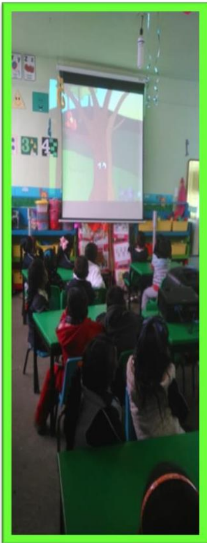
Evidencia, fotografía original

¿Qué creen? la maestra se sentó a platicar con nosotros y dice que la ONU, es una organización de muchos países, que quiere lograr un mundo más feliz y saludable para el año 2030, para entonces ya vamos a estar muy, muy grandes, nosotros nos comprometimos ayudando desde nuestro mundito, invitando a participar en mejorar, que el pueblo tenga un desarrollo sustentable (Preescolar, 2004, págs. 37-50) y podemos sembrar ricas verduras, que cuando crezcan, las vamos a comer, porque cada pequeña participación, significa mucho para el planeta, ¿Cómo? a pues al hablar con las familias y amigos sobre las acciones que pondremos en práctica desde casa.