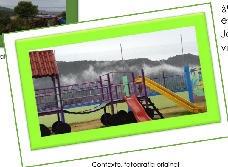
Contexto, fotografía original

El otro día, llevamos a nuestra escuela fresas, ¡mmmm! Sí, de esas... de las que le ayudamos a mi mamá a regar en la casa.