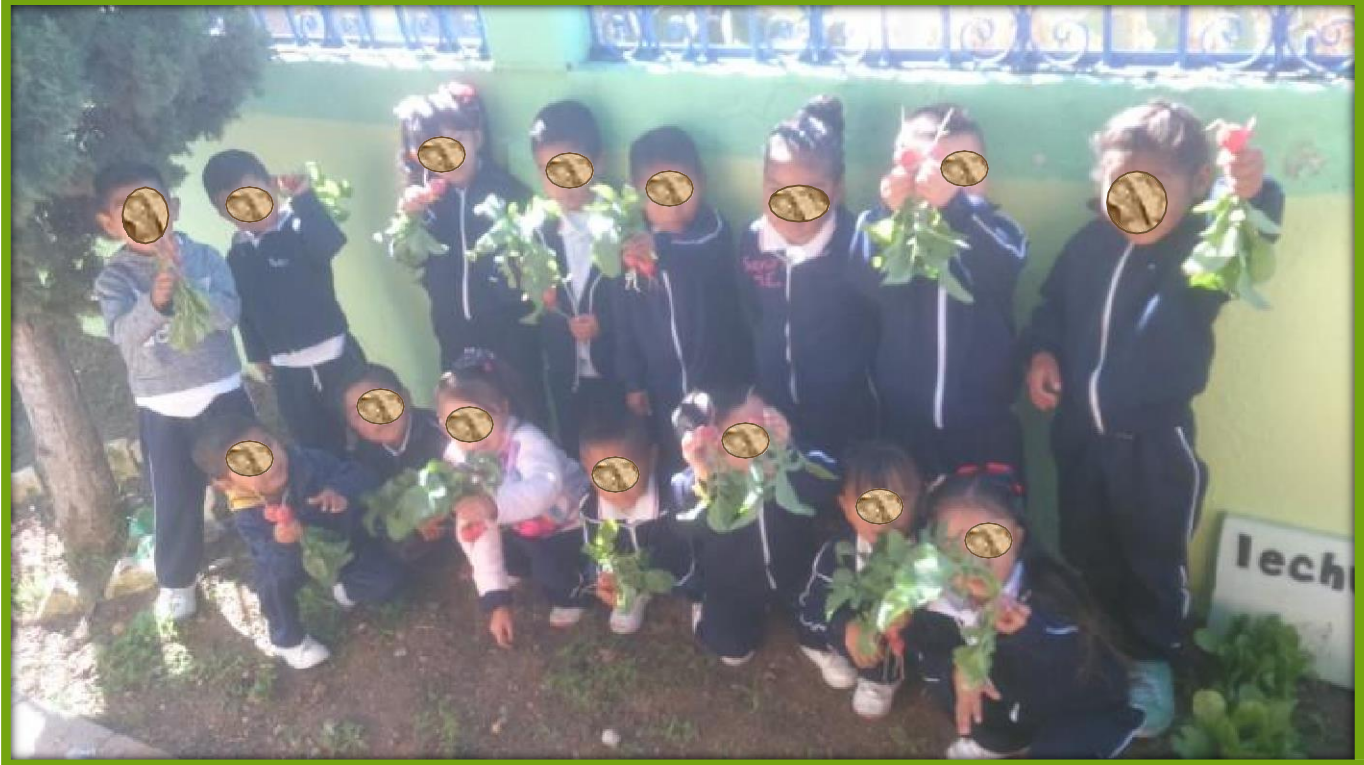
Cosecha de productos, fotografía original

Al término de la cosecha, nuestras mamás mostraron a cada uno de los clubes ( http://creson.edu.mx/modeloeducativo/Clubes%20Propuestos/mi%20huerto.pdf , s.f.) las verduras colectadas y nos dieron una gran sorpresa, que ¡las compartirían con todos los compañeros de la escuela en una granfiesta!