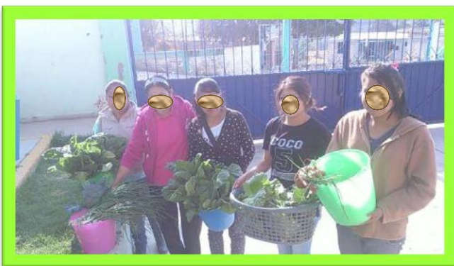
Cosecha de productos, fotografía original