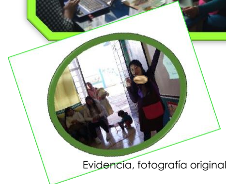
Evidencia, fotografía original

¡Bueno, bueno!, para pronto, los clubes nos ayudarán a favorecer nuestro desarrollo integral, y a vivir experiencias que contribuyan a nuestro proceso de desarrollo y de aprendizaje.