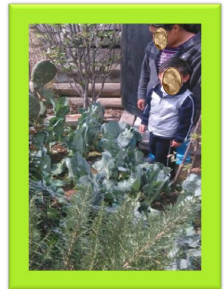
Cosecha de productos, fotografía original

Participar en este club, sí que fue emocionante, hasta algunas mamás quisieron hacerlo en casa, Horta – DIF les trajo paquetes de semillas y entonces "Sí, manos a la obra en casa y que nadie se quede fuera."