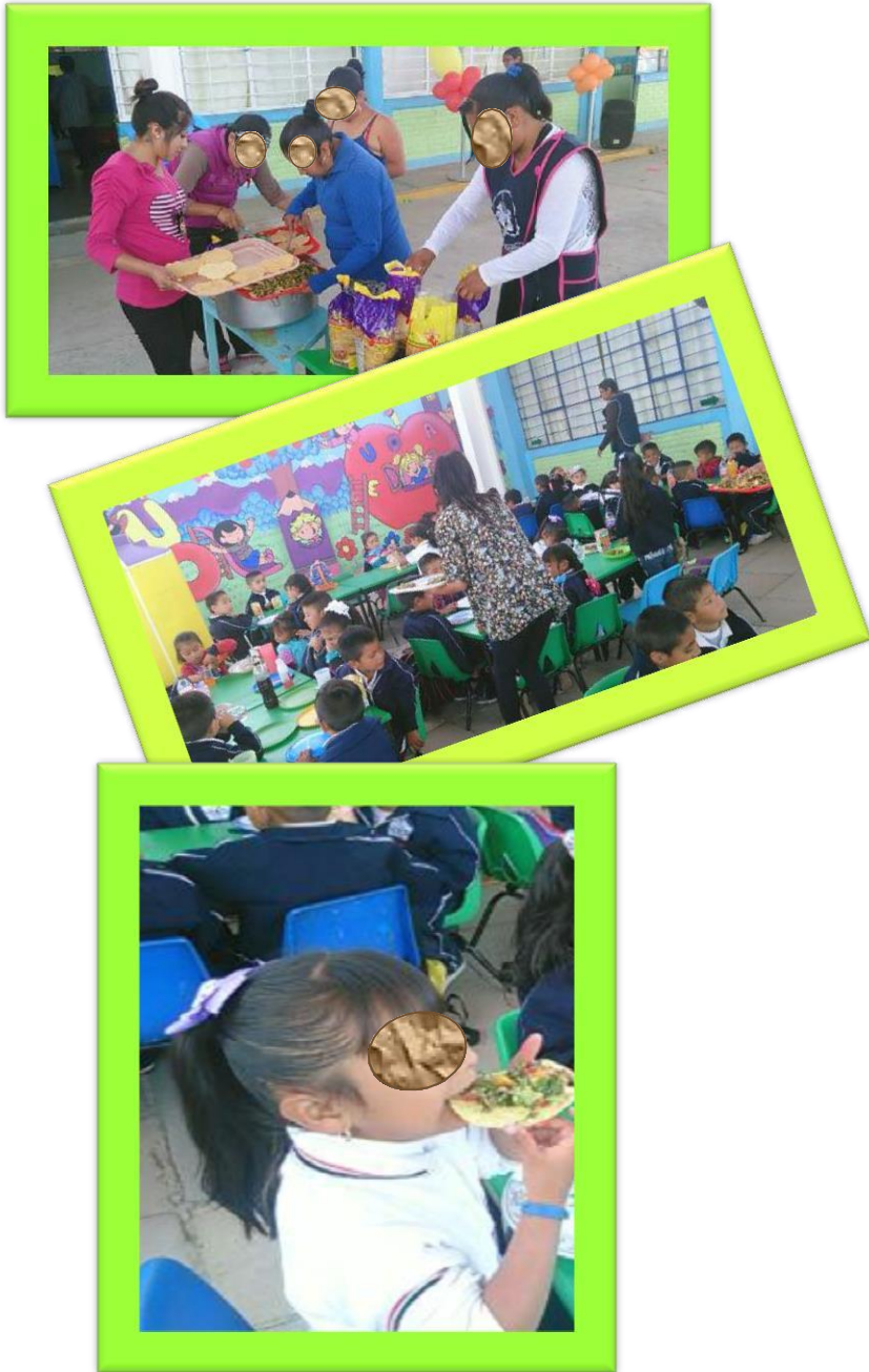
Evidencias, fotografía original

Mmmmm... ¿Por qué saboreo? aah, pues es por recordar ¡mmmmm, el delicioso sabor de las tostadas verduricas! que nuestras mamitas prepararon para festejar "El Día de la Tierra" por supuesto ¡Le agradecemos por las verduras que nos dio para todos los chicos de la escuela!