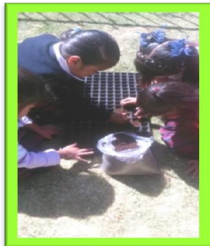
Evidencia, fotografía original

Sí, ¡Es bien emocionante! sentir las semillas con tus manos, son de distintos colores y tamaños, la maestra nos dijo que solo podemos utilizarlas para sembrar y jamás debemos meterlas a la boca, pues eso nos haría daño; nosotros respetamos los acuerdos y participamos en el proceso, para ello utilizamos un semillero, donde agregamos sustrato y después depositamos la cantidad de semillas acordada.