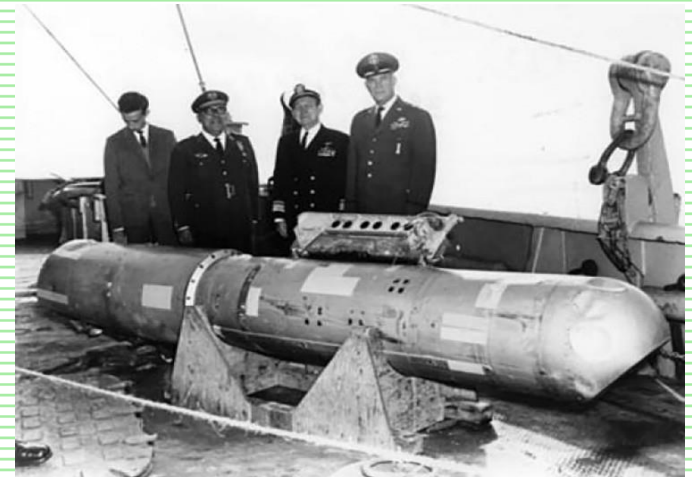
Bomba nuclear. (2016, 7 marzo). [Fotografía]. RT.