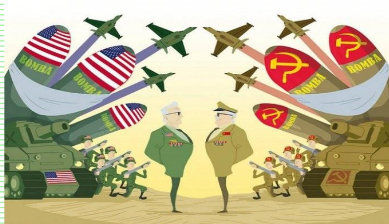
Brezina, N. (2017, 9 julio). Estados Unidos y la URSS: La informática durante la Guerra Fría [Ilustración]. Estados Unidos y la URSS.

Unión Soviética: encabezada por el bloque Oriental. Defendía el comunismo.