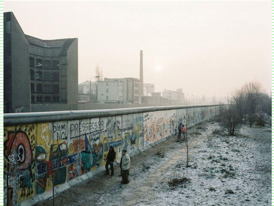
Blakemore, E. (2019a, noviembre 12). El Muro de Berlín [Fotografía]. National Geographic.

Medía 43 kilómetros y estaba protegido con alambres de púa, perros de ataque y cerca de 55 000 minas. Su caída ocurre el 9 de noviembre, de 1989.