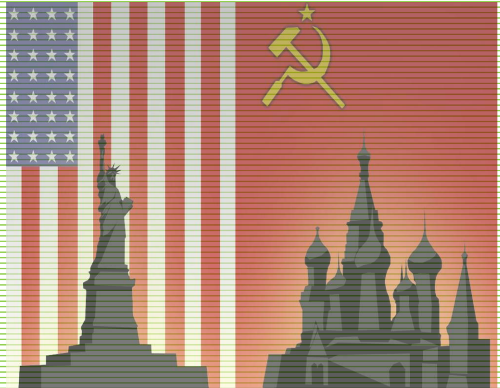
Guerra fría. (s. f.). [Ilustración]. Guerra fría.

La Guerra Fría fue un enfrentamiento político, ideológico y cultural ocurrido entre 1945 y 1989, entre Estados Unidos de América y la Unión de Repúblicas Socialistas Soviéticas