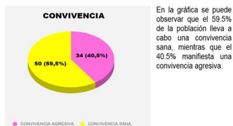
Ilustración 1 Elaboración propia

De una población de 176 alumnos, se tuvo la oportunidad de realizar la muestra en 84 niñas y niños, de los cuales 34 alumnos se peleaban por las sillas ocasionando conductas agresivas, se quitaban y/o pegaban por el material, les costaba trabajo expresar abiertamente sus sentimientos, pensamientos y deseos e intentaban comunicarse de forma indirecta, entre otros aspectos. Es importante mencionar que dicha muestra dio pauta para la implementación del proyecto de manera institucional.