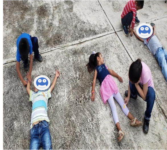
Act. Identificarse a sí mismo