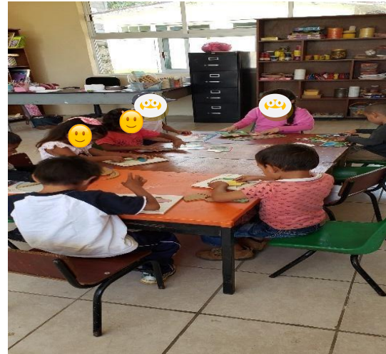
Act. De adaptación