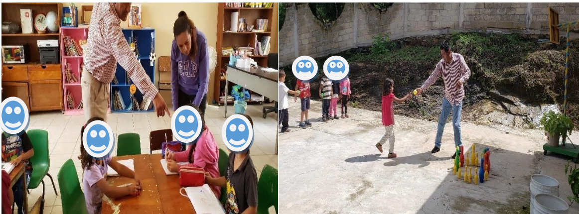
Visitas de la autoridad de Supervisión

Actualmente la escuela que atiendo se le está dando seguimiento por parte de la autoridad escolar ( Desempeño de las autoridades escolares ), esto con el fin de determinar los avances y necesidades que se presentan en el aula escolar y brindarnos el apoyo necesario.