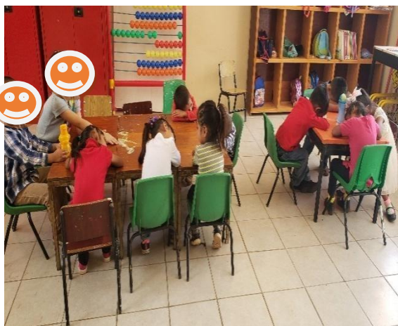
Alumnos nuevos aprendiendo reglas