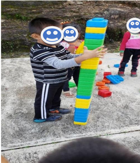
Act. Que tan grandes son