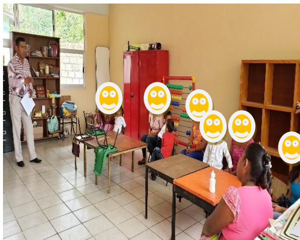
Platica del supervisor a padres de familia

Respecto a Infraestructura y equipamiento , a finales del ciclo escolar anterior la escuela se vio beneficiada con un programa federal llamado Escuelas al Cien, el recurso fue ejercido sólo en el aula donde se rehabilitó casi en su mayoría, por lo que actualmente luce en perfectas condiciones, por el contrario, días antes de iniciar el ciclo presente por motivos climatológicos un árbol cayó sobre un tramo de barda perimetral de la escuela por lo que no ha afectado pues era algo con la que ya se contaba y aparte hay muchos recursos de infraestructura que se requieren por ejemplo, construir una cisterna, corregir un paredón que representa un peligro para todos los que estamos dentro de la escuela, los baños están muy deteriorados y sólo funciona uno, se necesita también mobiliario para los alumnos, un pintarrón, equipo de cómputo, material didáctico, y demás. Esperamos contar con el apoyo de las autoridades municipales y ojala la escuela pueda volver a entrar en otro programa de apoyo escolar.