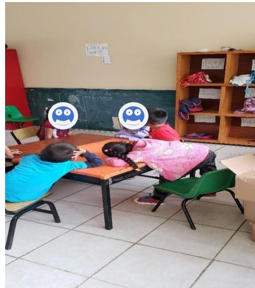
Act. Descríbete frente al espejo

En cuanto al ámbito de formación docente , hasta el momento sólo nos hemos acercado con otras compañeras docentes durante el CTE donde podemos compartir experiencias, temas de didáctica, cómo enfrentar situaciones con los alumnos o que actividades podemos poner en práctica y que sean funcionales para mi grupo o en específico de un niño. Lo importante es no dejar desapercibido la importancia de dar lo mejor de uno como docente y reconocer cuando algo no está funcionando y buscar los elementos, materiales o el apoyo requerido.