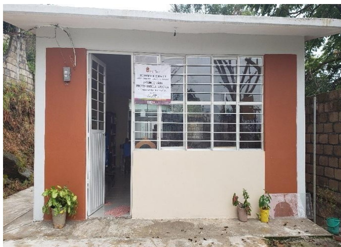
Aula beneficiada (programa federal)

Respecto a Infraestructura y equipamiento , a finales del ciclo escolar anterior la escuela se vio beneficiada con un programa federal llamado Escuelas al Cien, el recurso fue ejercido sólo en el aula donde se rehabilitó casi en su mayoría, por lo que actualmente luce en perfectas condiciones, por el contrario, días antes de iniciar el ciclo presente por motivos climatológicos un árbol cayó sobre un tramo de barda perimetral de la escuela por lo que no ha afectado pues era algo con la que ya se contaba y aparte hay muchos recursos de infraestructura que se requieren por ejemplo, construir una cisterna, corregir un paredón que representa un peligro para todos los que estamos dentro de la escuela, los baños están muy deteriorados y sólo funciona uno, se necesita también mobiliario para los alumnos, un pintarrón, equipo de cómputo, material didáctico, y demás. Esperamos contar con el apoyo de las autoridades municipales y ojala la escuela pueda volver a entrar en otro programa de apoyo escolar.