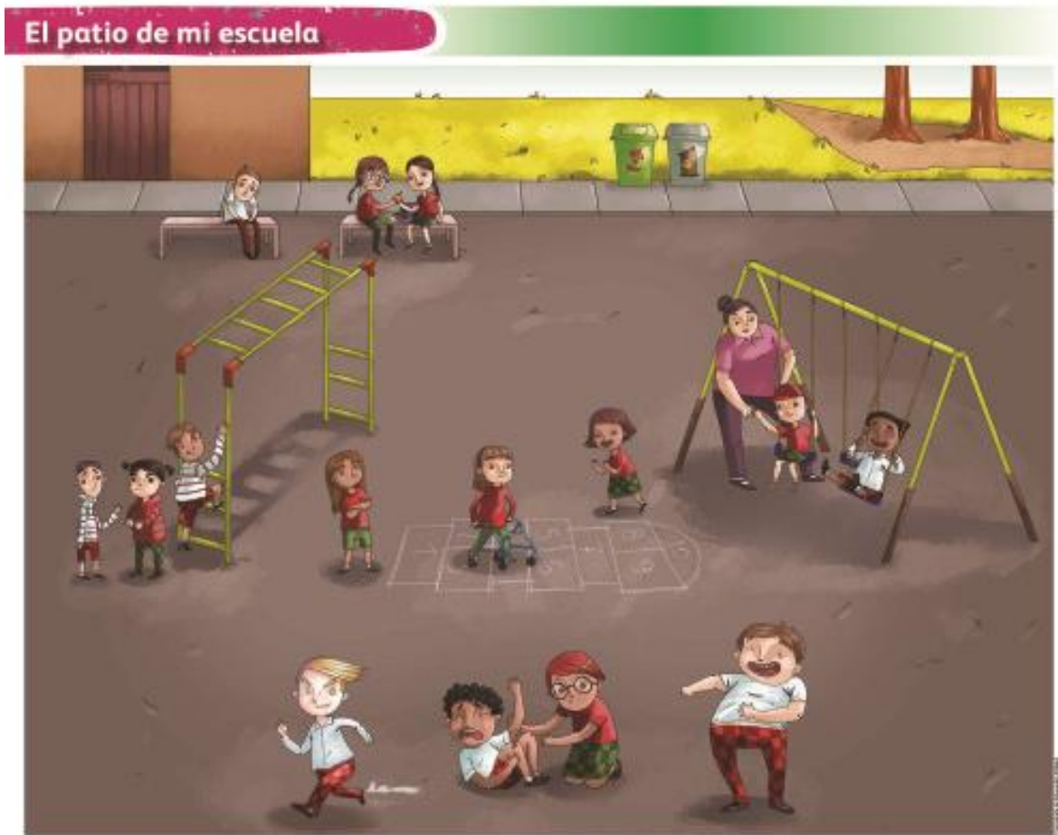
LÁMINA DIDÁCTICA SEGUNDO GRADO EL PATIO DE MI ESCUELA ÁREA DE DESARROLLO PERSONAL Y SOCIAL: Educación socioemocional

FINALIDAD 1.- Hablan sobre cómo les gustaría que los apoyarán en ciertas situaciones o cómo lo harían ellos con sus compañeros.