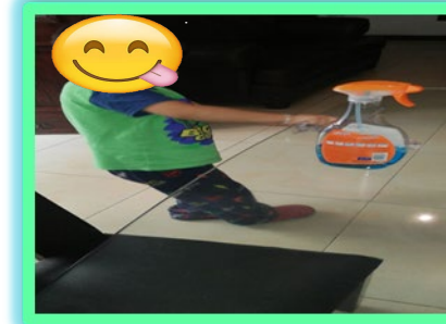
BAZTIAN TADEO 3 "A"