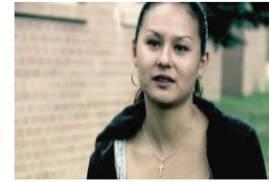
La Verdad sobre los Analgésicos