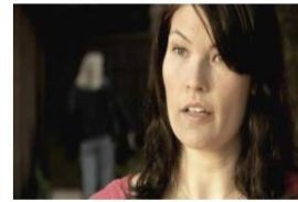
La Verdad sobre el LSD