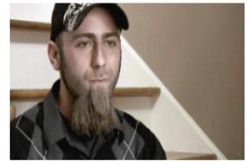
La Verdad sobre los Fármacos de Receta