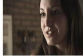
La Verdad sobre el Crack