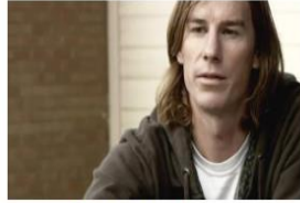
La Verdad Sobre la Marihuana