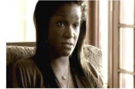
La Verdad sobre la Metanfetamina de Cristal