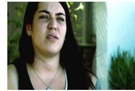
La Verdad sobre la Heroína