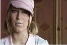
La Verdad sobre el Éxtasis