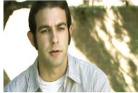
La Verdad sobre la Cocaína