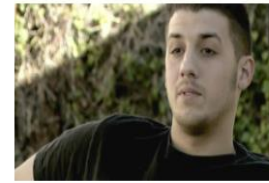
La Verdad Sobre los Inhalantes