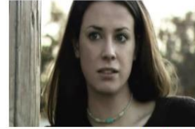
La Verdad sobre el Alcohol