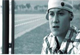
La Verdad sobre las Drogas