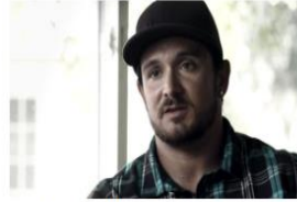
La Verdad Sobre las Drogas Sintéticas