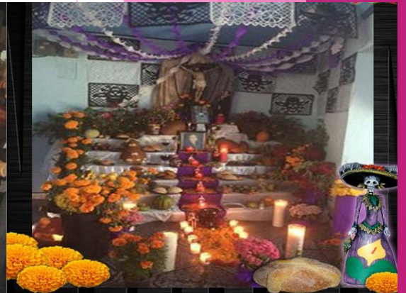
A #10 FAM. OROZCO SALAZAR