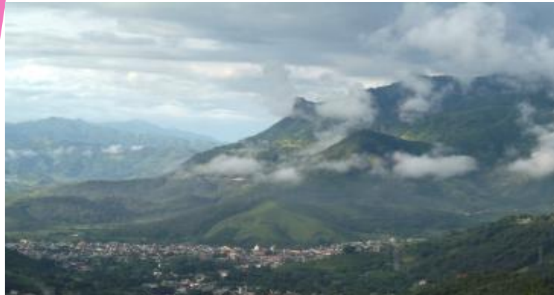
Costumbres y Tradiciones de Tejupilco

ESTAS SON ALGUNAS DE LAS IMÁGENES QUE UTILIZARON EN LA EXPOSICION DE LA MONOGRAFIA