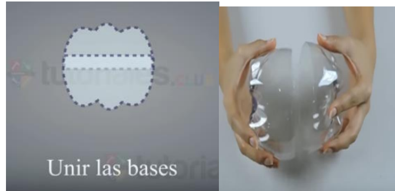
2.- Unir las bases