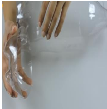
1.- Cortar las botelas