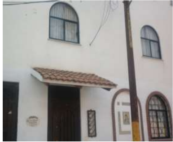
Fotografía No5.

El fraccionamiento está separado de la escuela por un canal de aguas negras, que marca una enorme diferencia social y económica de un lado y otro, tal y como se aprecia en las fotografías 6 y 7. Con la venta de terrenos ejidales, se han formado otras colonias como la Lázaro Cárdenas y Ejidos, muy cercanas a la institución y que aún carecen de servicios por lo que son consideradas como urbano-marginal.