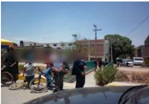
Fotografía No.6 Por BDG