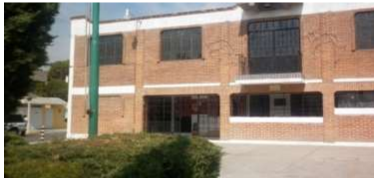
Fotografía No. 8

“Delegación del fraccionamiento El Tejocote” (Junio-2011)