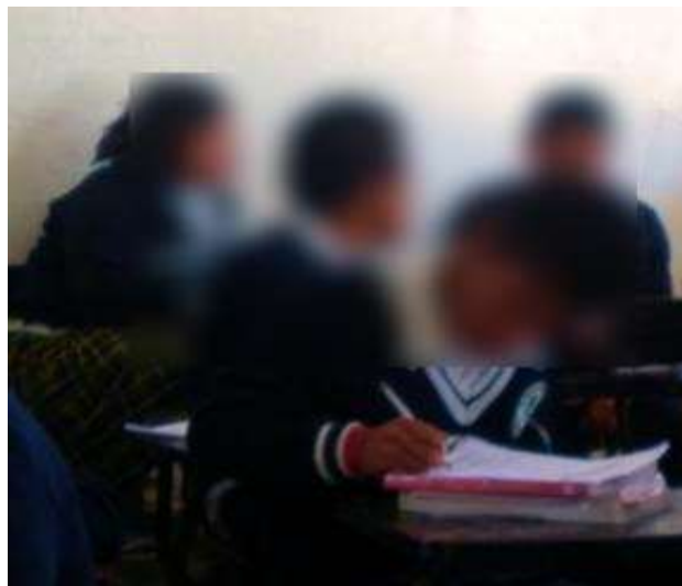
Fotografía No.11.

“Itzel con sus compañeros de clase” (Marzo-2011)