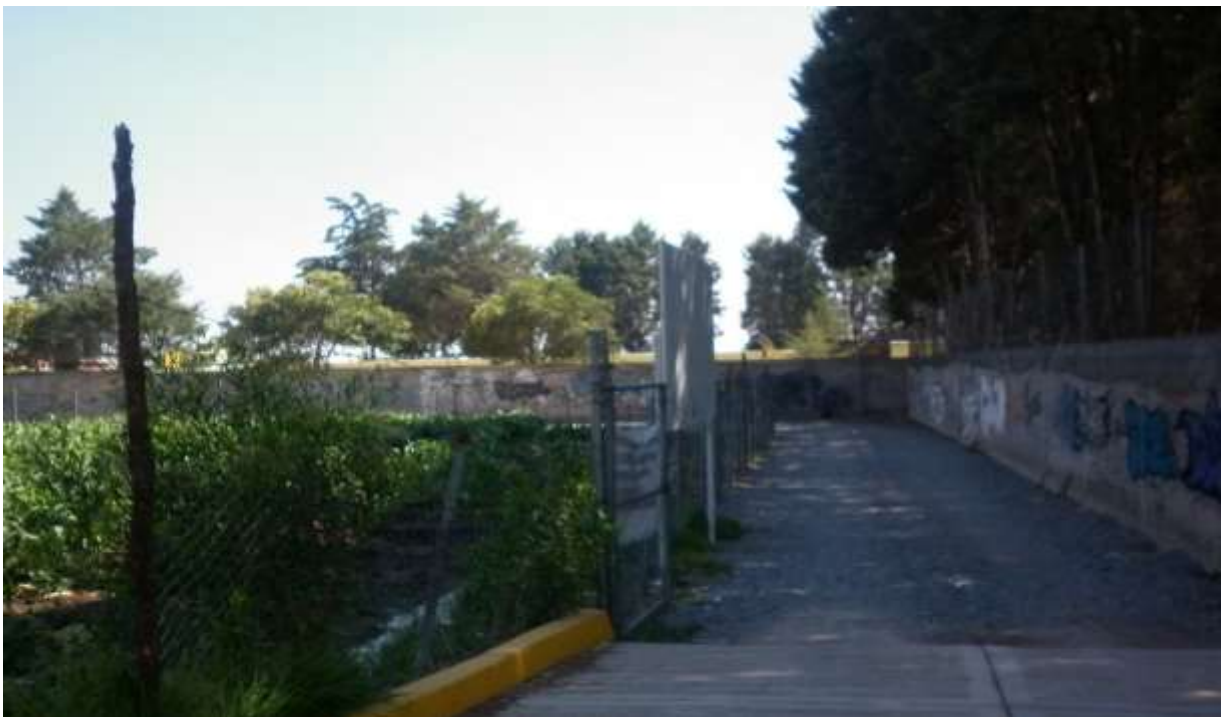
Fotografía No.19.

“Entrada de grafiti y conocimiento, secundaria Diego Rivera” (Junio-2011)