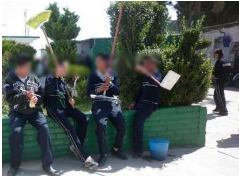
Fotografía No. 15.

En estos espacios se comparten la interacción social con la institucional como parte de la vida cotidiana, en la que se construye con varias dimensiones: una espacial, una temporal una intersubjetiva y una institucional, se estructura en coordenadas espaciales y temporales; en el aquí y ahora de los sujetos y se construye de manera intersubjetiva con los otros que también organizan su mundo en torno a sus experiencias y su aquí y ahora; aunque comunes sus perspectivas que tienen los otros de su mundo, siempre son distintas. (Schütz, 2003).