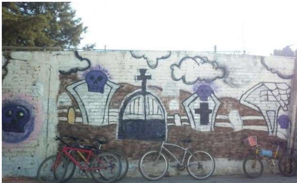
Fotografía No.14. Por BDG

“Celebración de Día de Muertos en grafiti” (Enero-2011)