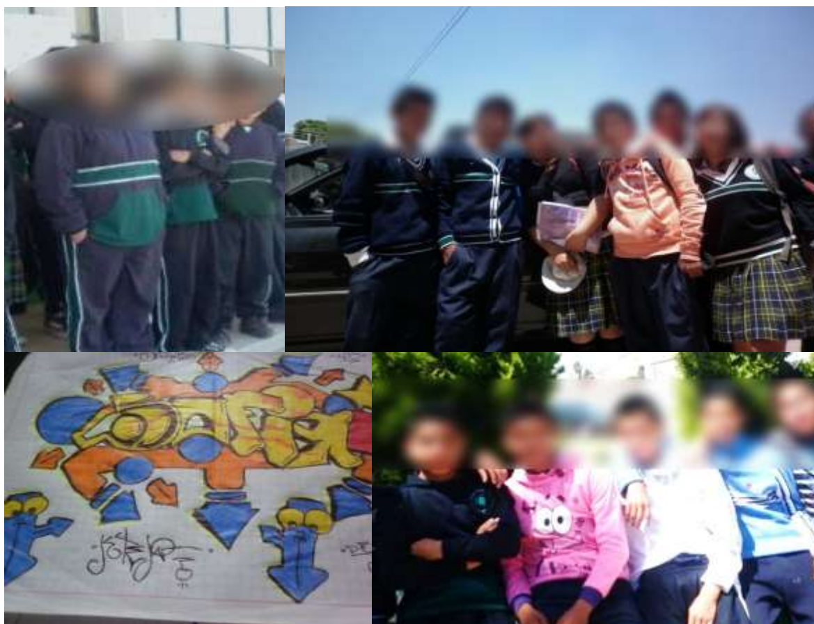
Fotografía No.9.

“Adolescentes y grafiti en la secundaria Diego Rivera” (Enero-2011)