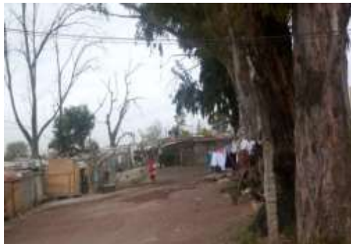
Fotografía No.7

La escuela está rodeada en tres de sus lados por campos de cultivo de maíz, sorgo o avena que se siembran de acuerdo a la época del año; en el cuarto lado se encuentra la escuela primaria y al lado de ésta, un campo de futbol, terrenos que fueron donados por un español, al que se le solicitó hace cuatro años aproximadamente por la dirección escolar donara otra porción de terreno para la entrada de la escuela, solicitud que fue aceptada.