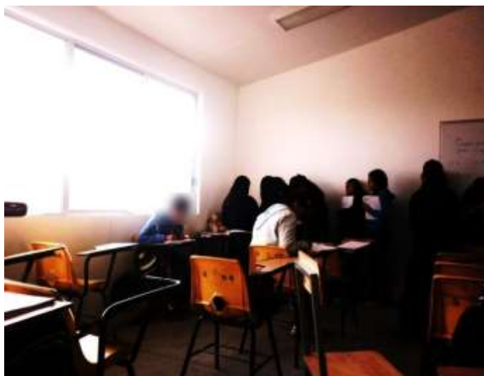
Fotografía No.12. Por BDG

La estrategia de la maestra orientadora del grupo de 3° “B”, después de observar y conocer a Diego, es tratar de integrarlo al grupo a través del apoyo entre los mismos compañeros, no sólo en la actitud, sino también en el aprendizaje, lo que implica un cambio en la normatividad, por lo tanto en los mecanismos y valores de dejar ser y hacer.