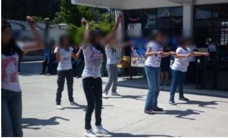
Fotografía No.17.

En este evento las alumnas se pusieron de acuerdo en el bailable, la música y el vestuario para la celebración de esa fecha.