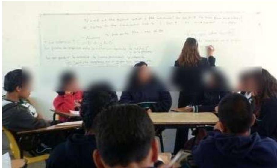
Fotografía No.16.