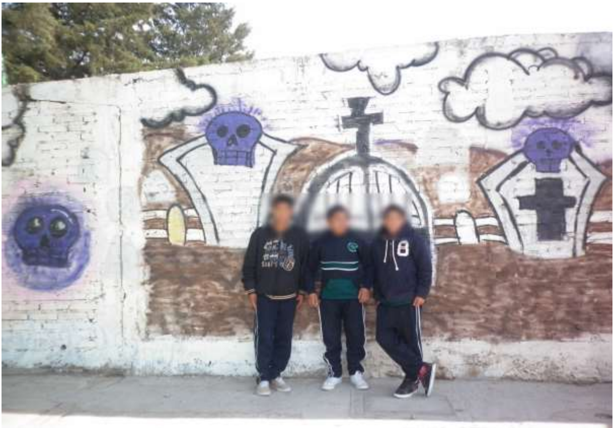
Fotografía No.18.

“Celebración de “Día de Muertos” (Enero-2011)