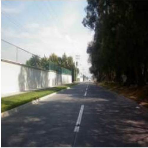
Fotografía No. 4. Por BDG.