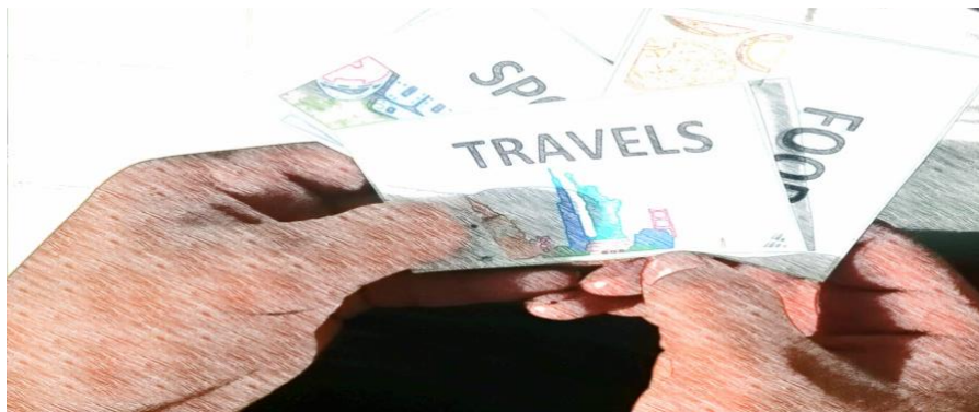
Ilustración 4. Tarjetas con temas

Para los alumnos que ya no son principiantes, no necesariamente que tengan un nivel intermedio o avanzado en Inglés, pero sí que ya tengan un mayor bagaje de vocabulario que les permita expresarse de manera más amplia. Esta actividad puede realizarse al concluir algún tema, para que todos tengan cierto vocabulario conocido o previamente practicado, se les dan tarjetas con temas de los cuales ellos puedan hablar un tiempo determinado, podría ser un minuto para poder cambiar a otro tema.