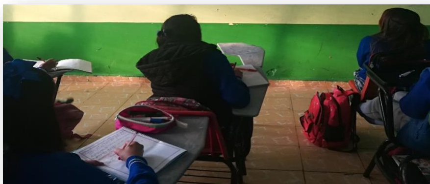
Ilustración 2. Filas en el aula.

Otra opción con las mismas tarjetas (ANEXO 1) para que los alumnos adquieran práctica y pierdan el miedo de hablar en voz alta es que se realice por filas, cada fila es un equipo y todos tienen las mismas preguntas, todos deben permanecer sentados y en silencio, se da la indicación de que se colocará un cronómetro y únicamente tendrán un minuto por fila para realizar sus preguntas y respuestas.