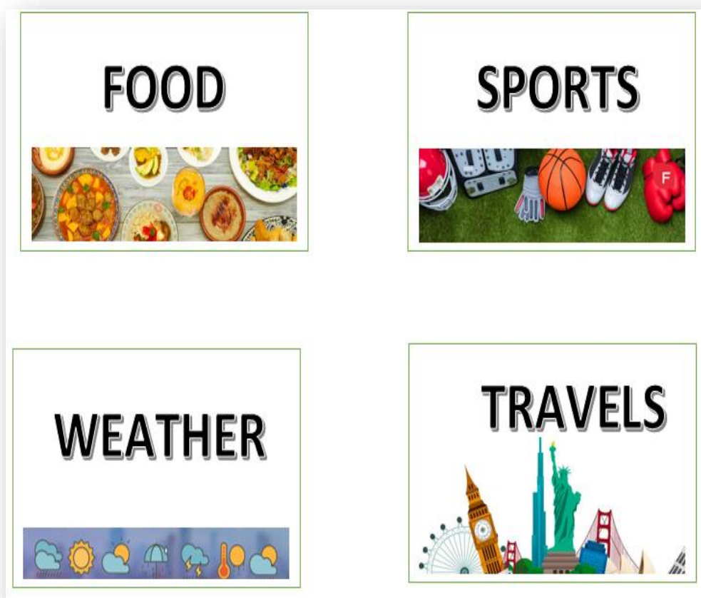
Ilustración 7. Tarjetas de temas para actividad de Small talks

Los temas son regulados por el docente para la creación de las tarjetas, ya sean de temas generales o respecto a los temas previamente revisados en clase.