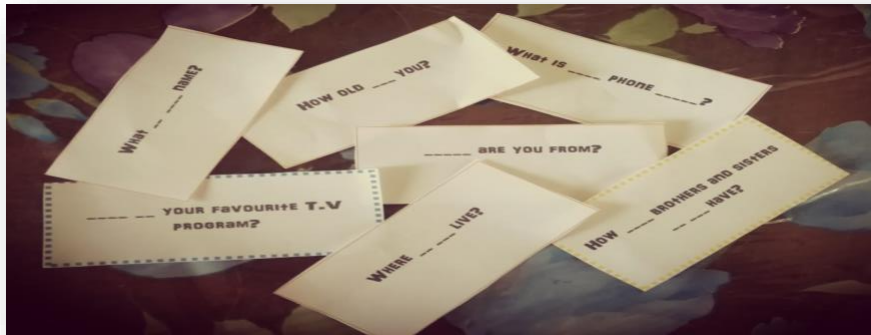
Ilustración 1. Tarjetas con “Wh questions”.

En esta actividad se requieren pequeñas tarjetas, las cuales llevan preguntas abiertas (Wh questions) incompletas, esto da oportunidad a que los alumnos deduzcan las posibles palabras de los espacios en blanco y formulen la pregunta oralmente. (ANEXO 1).