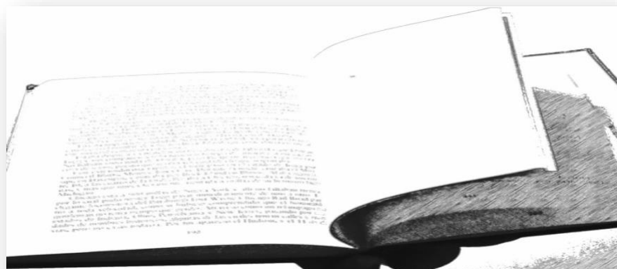
Ilustración 3. Lectura en voz alta.

De su libro de texto o alguna lectura corta, se les coloca el audio del diálogo o del texto que los alumnos pueden ir escuchando y leyendo al mismo tiempo, el audio se les coloca en una segunda ocasión para revisar que los alumnos están entendiendo el texto, una tercera ocasión permitirá que ellos puedan escuchar para así practicar con su compañera o compañero. Antes de continuar con el siguiente paso se resuelven dudas de alguna palabra o frase que les parezca complicada de pronunciar.