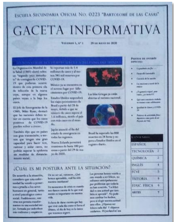
Figura 3: Gaceta informativa

Licenciada en Educación Secundaria con Especialidad en español.