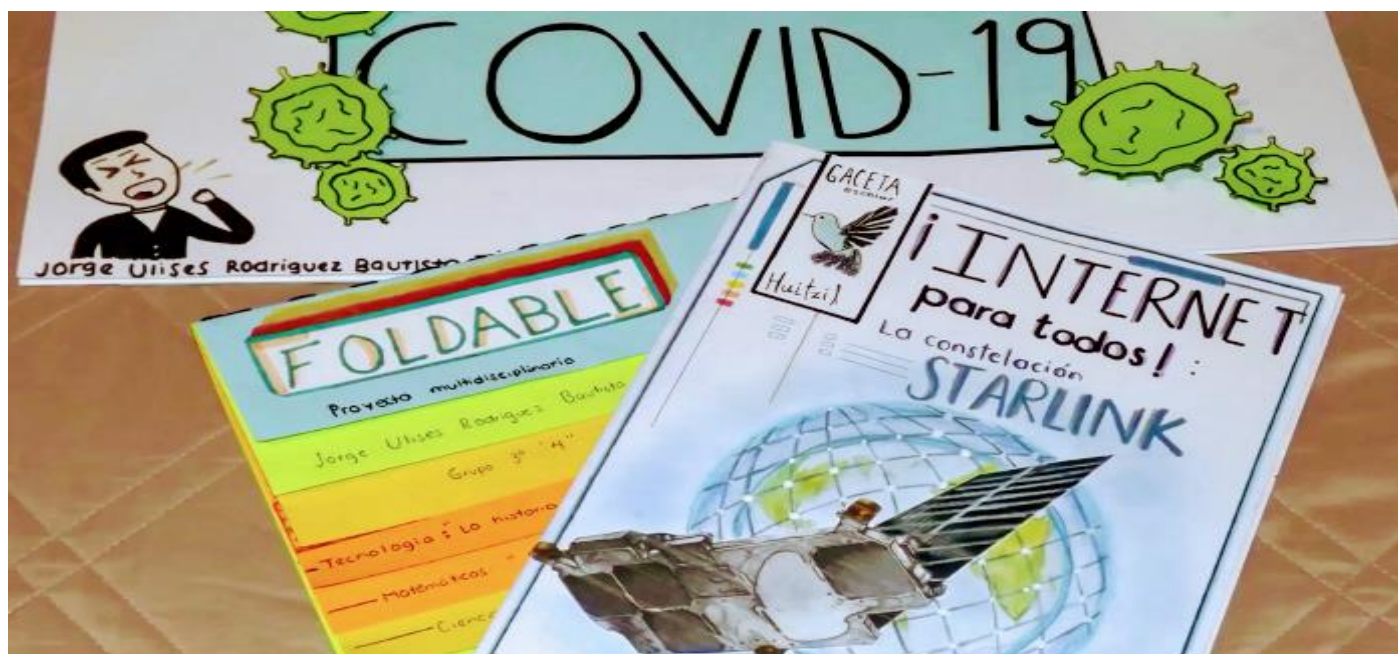
Fotografía: Productos finales