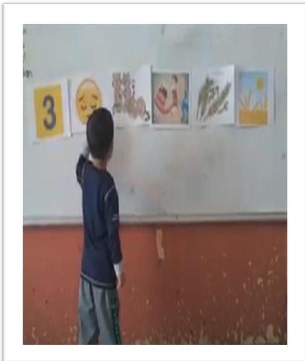
Actividad 2. "Relacionar las tarjetas para formar Rimas"