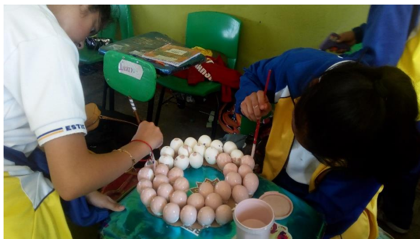
Anexo 5 Estudiantes realizando coronas navideñas