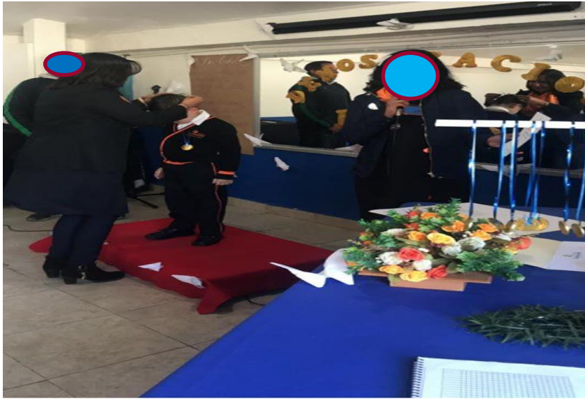
2020. Entrega de reconocimientos