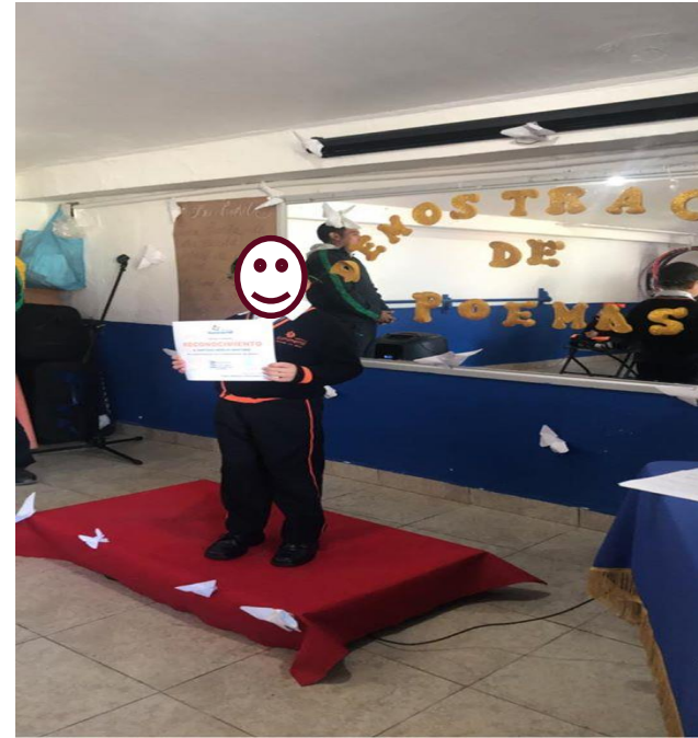
2020. Alumno mostrando su reconocimiento

SECRETARÍA DE EDUCACION SUBSECRETARÍA DE EDUCACIÓN BÁSICA Y NORMAL DIRECCIÓN GENERAL DE EDUCACIÓN BÁSICA SUBDIRECCIÓN REGIONAL DE EDUCACIÓN BÁSICA TOLUCA SUBDIRECCIÓN DE EDUCACIÓN BÁSICA JARDÍN DE NIÑOS SUMMERHILL CCT 15PJN6446T