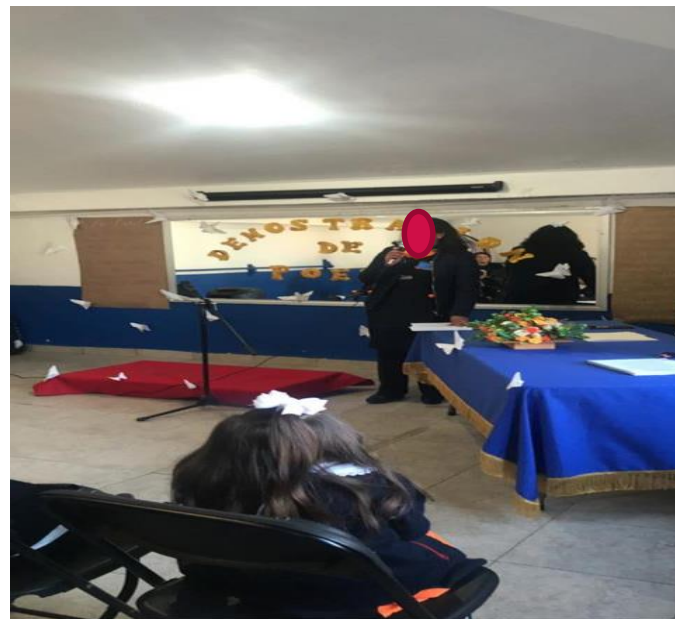
2020. Bienvenida a los padres de familia

SECRETARIA DE EDUCACION SUBSECRETARÍA DE EDUCACIÓN BÁSICA Y NORMAL DIRECCIÓN GENERAL DE EDUCACIÓN BÁSICA SUBDIRECCIÓN REGIONAL DE EDUCACIÓN BÁSICA TOLUCA SUBDIRECCIÓN DE EDUCACIÓN BÁSICA JARDÍN DE NIÑOS SUMMERHILL CCT 15PJN6446T