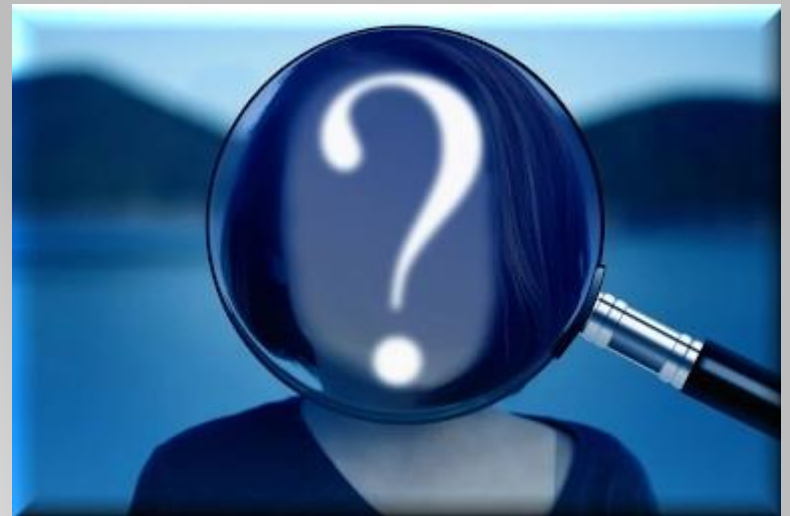
Imagen obtenida de: https://pixabay.com/es/illustrations/persona-signo-de-interrogaci%C3%B3n-4404750/