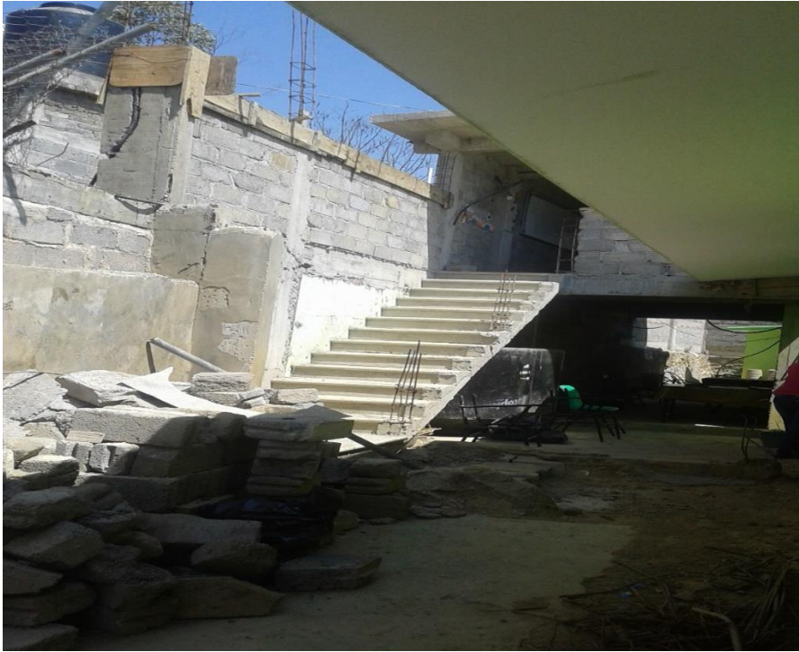
FUENTE: OFTV. No. 0569 Leona Vicario, El Cirián de la Laguna. Tejupilco, Méx.