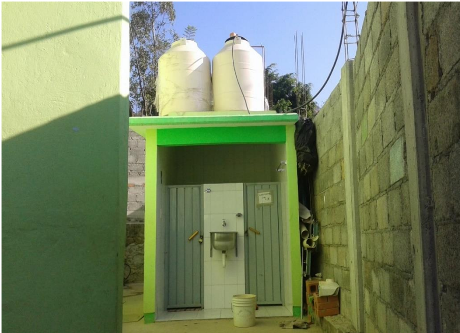
FUENTE: OFTV. No. 0569 Leona Vicario, El Cirián de la Laguna. Tejupilco, Méx.