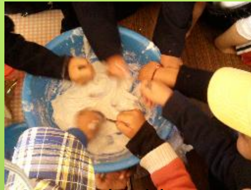
Mix and add