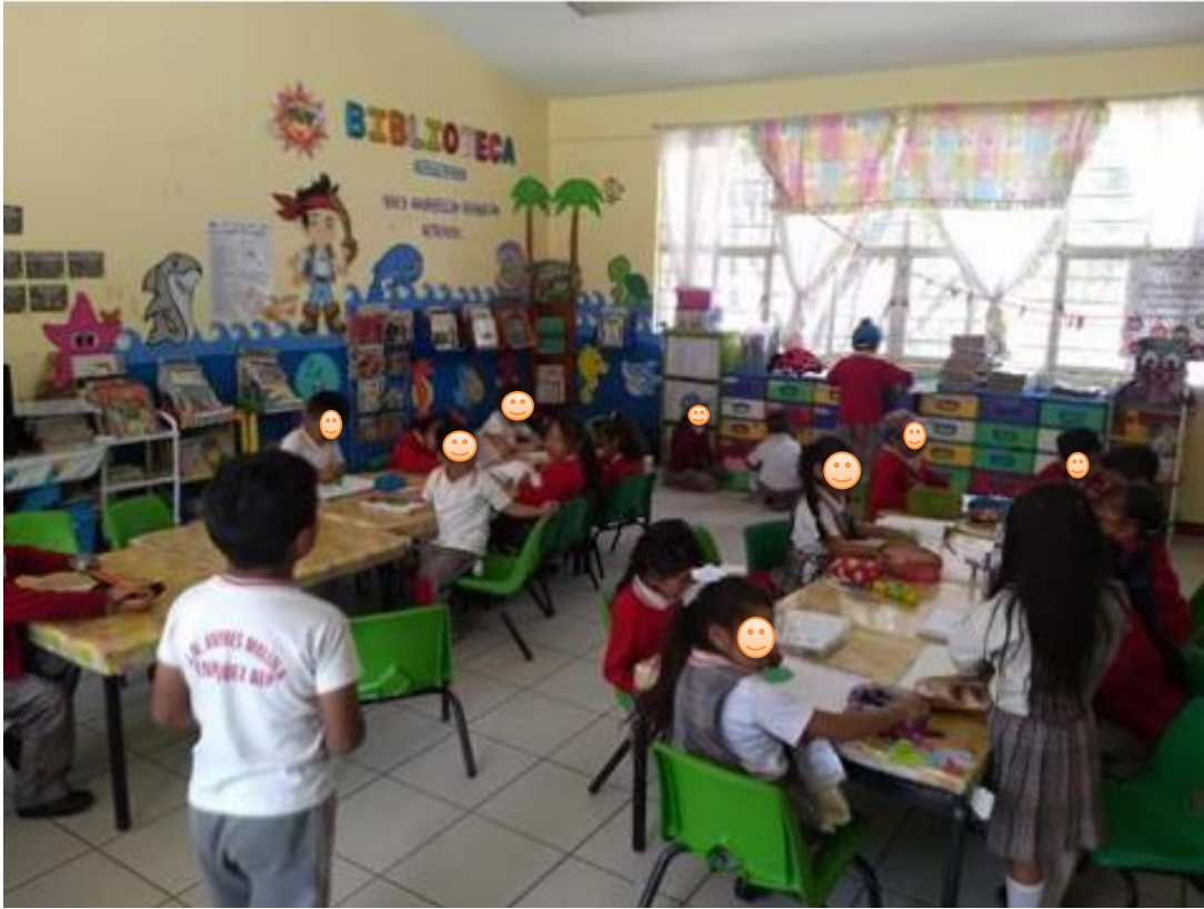
Grupo de 3°. "A"