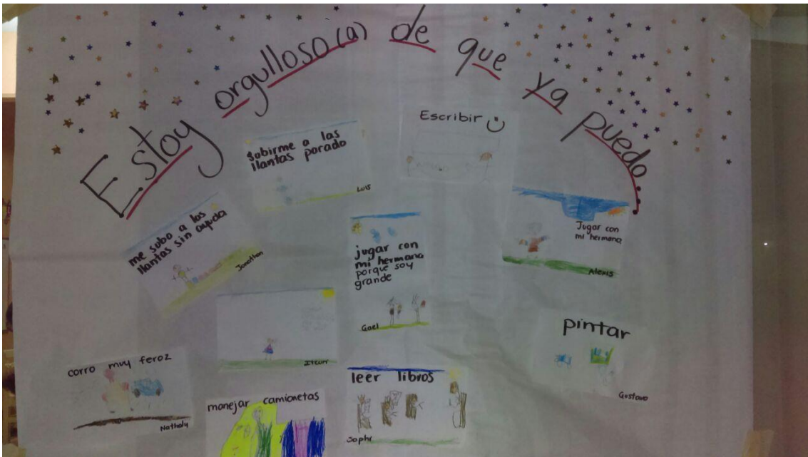
Actividades realizadas por los alumnos para fortalecer la autoestima