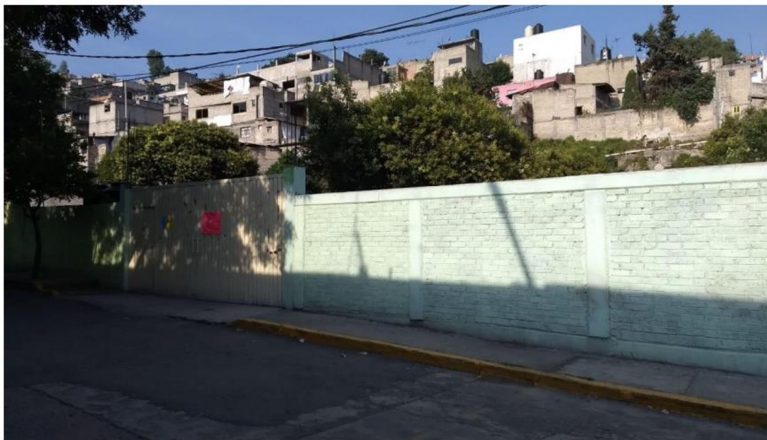
Fachada, puerta principal del Jardín de Niños “Andrés Molina Enríquez A.E.P.”