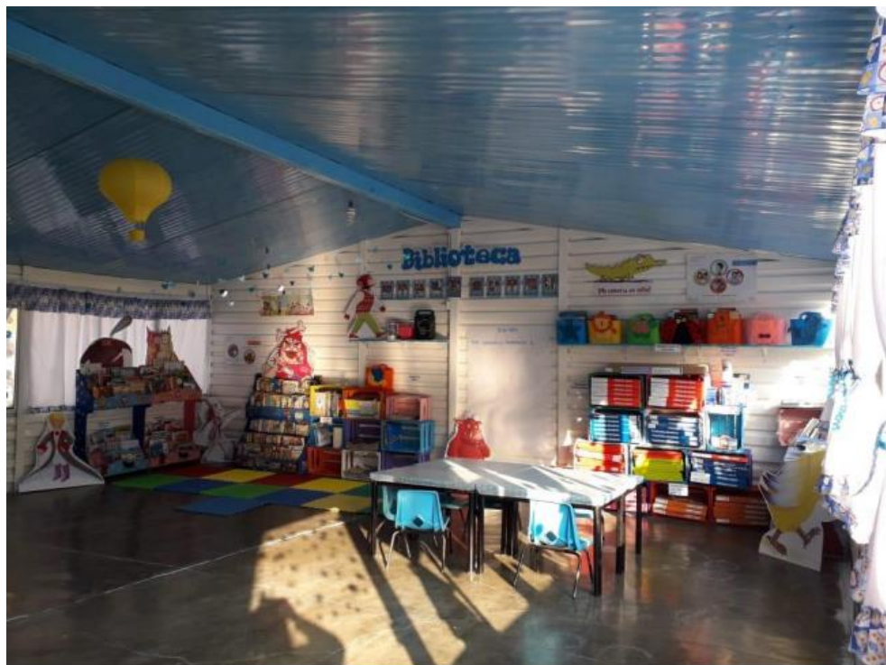
Biblioteca Escolar "Un espacio para investigar, imaginar y recrear"