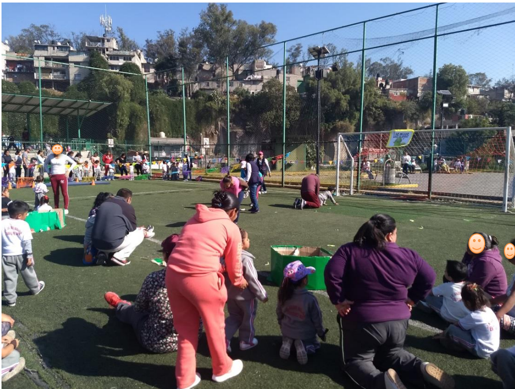
Actividades con padres de familia para fortalecer la convivencia