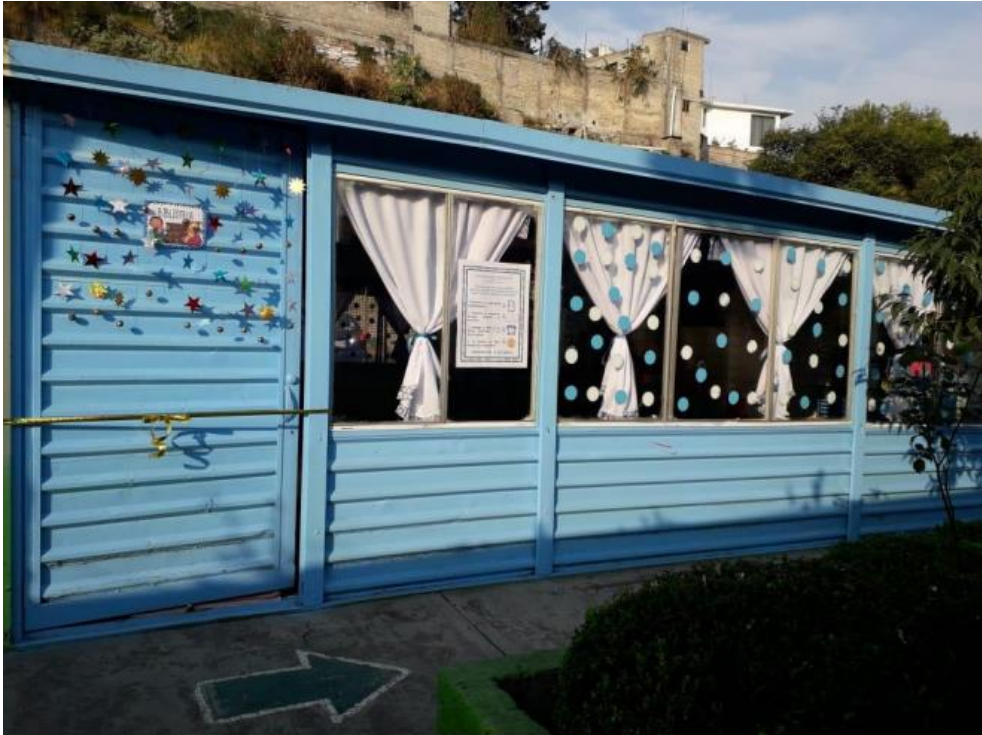
Fachada de la Biblioteca Escolar