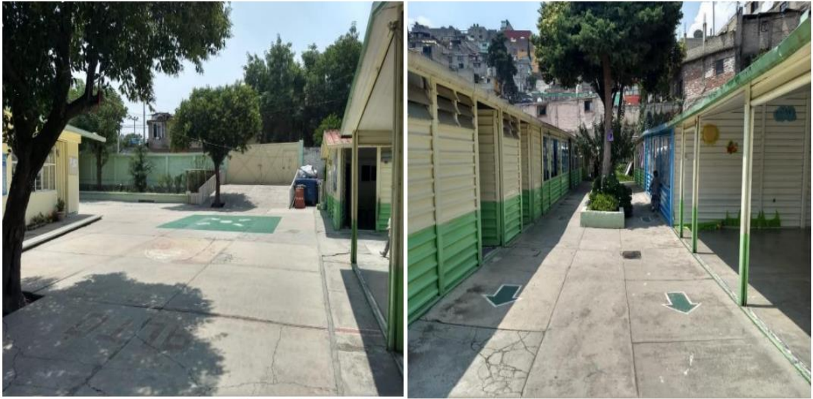
Accesos a las aulas y espacios comunes