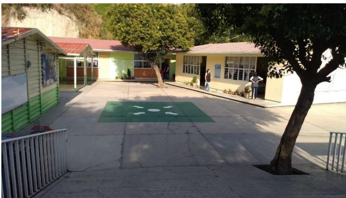
Acceso principal Jardín de Niños “Andrés Molina Enríquez A.E.P.”