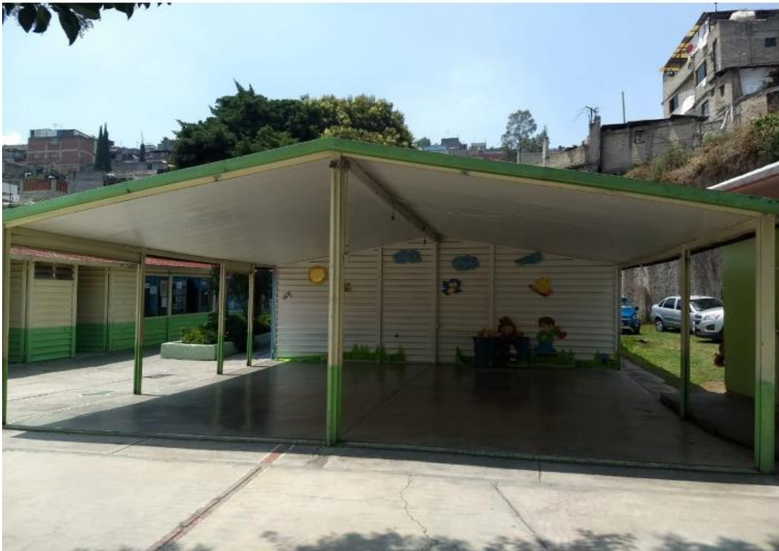
“Casita de los amigos” Espacio para la convivencia escolar