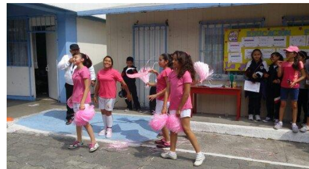
EXIBICION DE LA PORRA