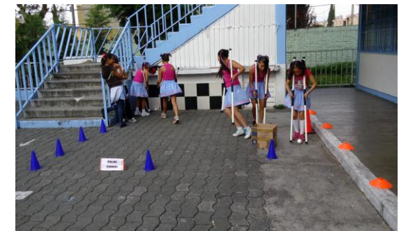
DESAFIO: PALOS CHINOS