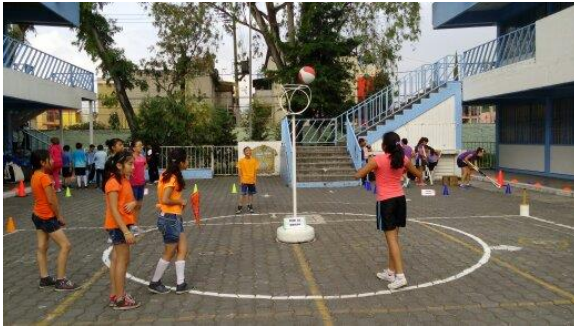
DESAFIO: TIRO AL UNIGOL