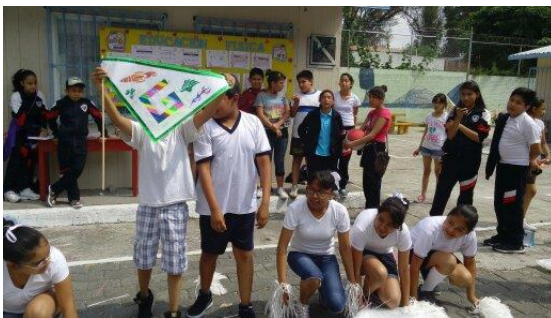
EXIBICION DEL BANDERIN