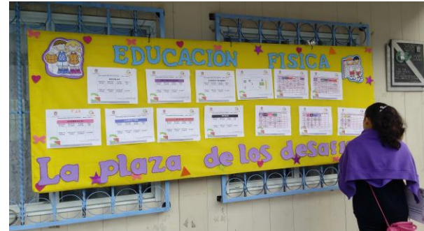
TABLERO DE CONTROL