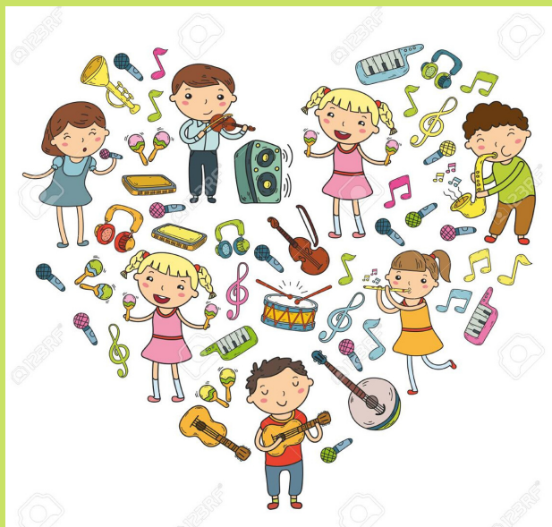
Figura 1. Fichas para la atención por Maribel Martínez Camacho y Ginés Ciudad Real s.f