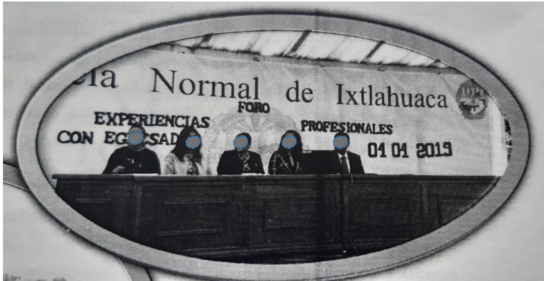
Ceremonia de Inauguración del Foro, en el Auditorio abierto de la ENI

Material fotográfico extraído de la Revista “Productos académicos del programa de seguimiento a egresados”. Mayo de 2019