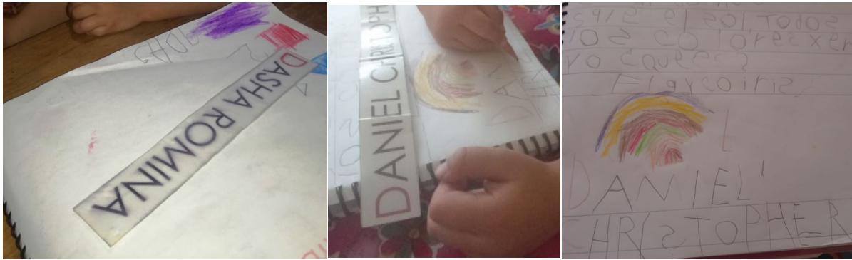
Estos son algunos resultados del trabajo que se obtuvieron con la planeación: “Mi nombre”