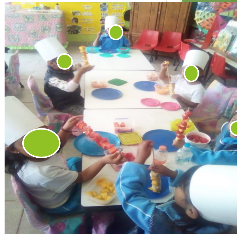
PREPARANDO SUS COMIDAS QUE A ELLOS LES GUSTAN Y PUEDAN DISFRUTARLAS.