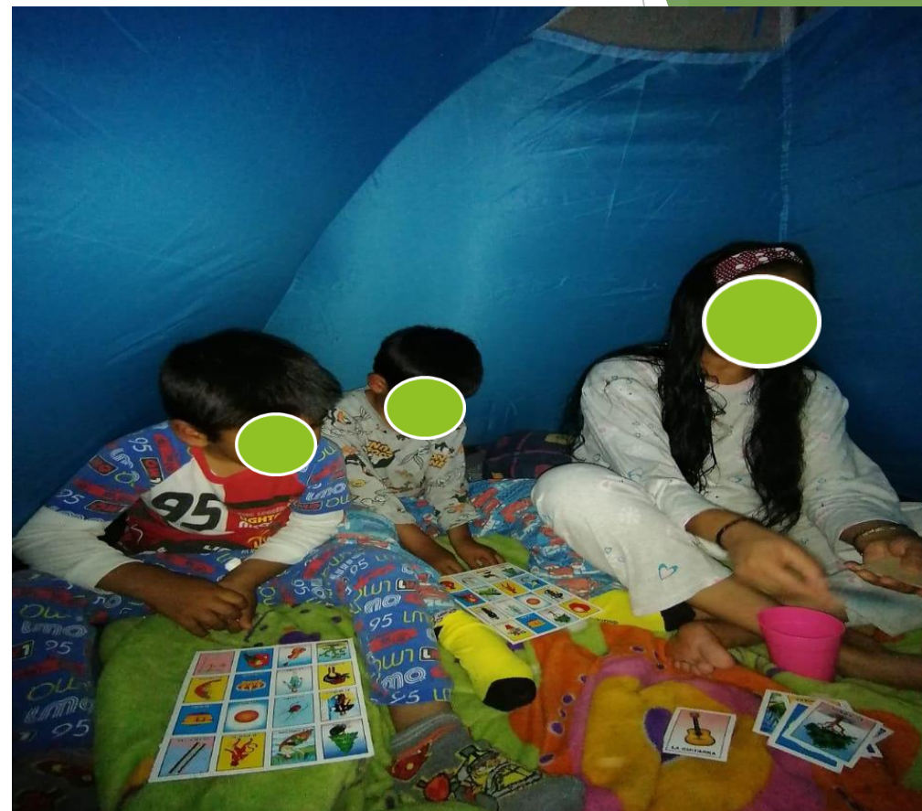
LOTERIA CON PADRES DE FAMILIA: SE FOMENTA TANTO EL FORTALECIMIENTO DE LAS EMOCIONES Y EL AUTOESTIMA COMO LA ATENTA ESCUCHA , MEMORIA, OBSERVACIÓN.