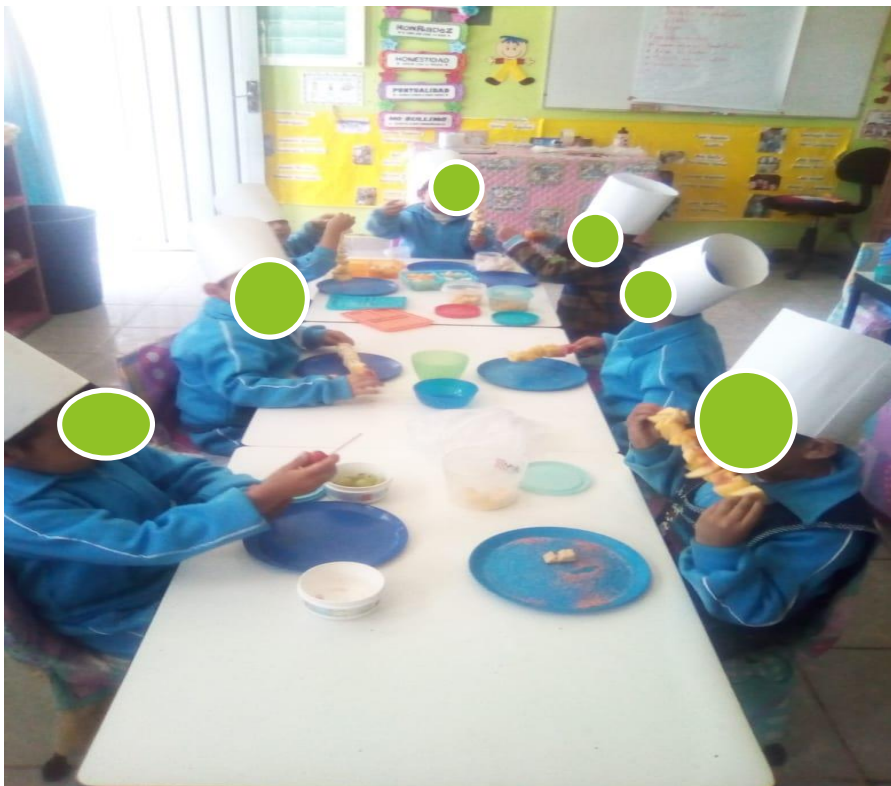
BROCHETAS DE FRUTAS: CUIDADO DE LA SALUD, RECONOCEN LA IMPORTANCIA DE LA ALIMENTACIÓN CORRECTA, EL PROYECTO DEL “CHEFF”