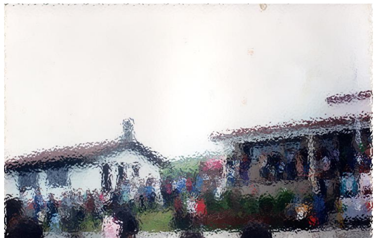
1997. Aniversario de la Revolución Mexicana en la escuela