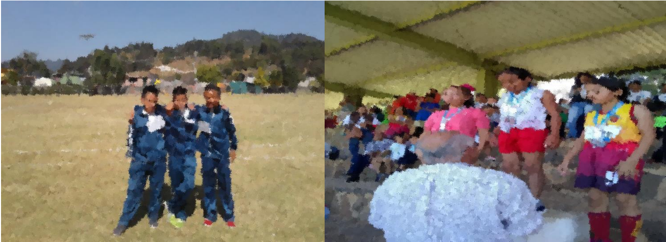
Participación de alumnos de la escuela en los Juegos Deportivos de Educación Primaria a nivel región y estatal