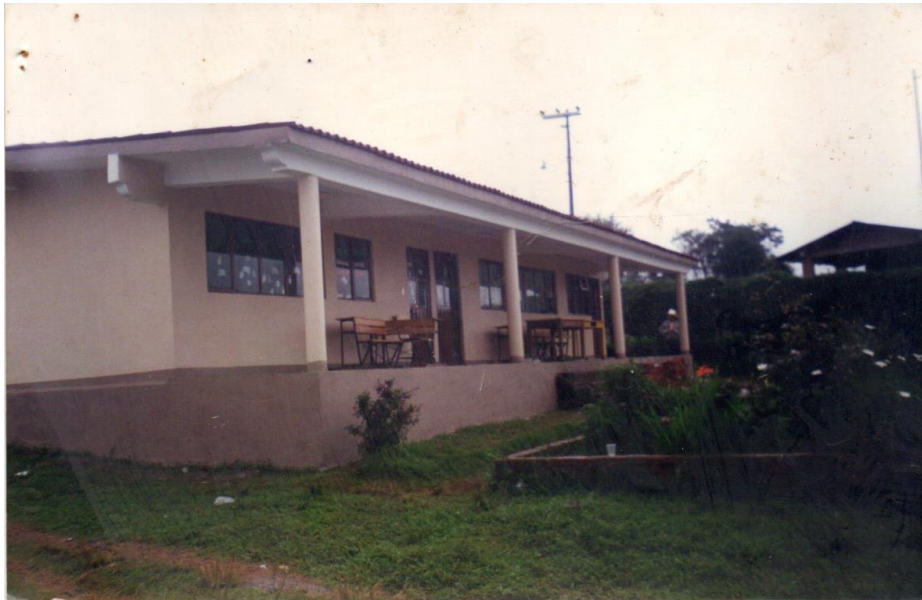
1996. La escuela después de la remodelación

Para el año de 1996, la escuela sufrió una remodelación en su infraestructura; se remodelaron las dos aulas y la cancha deportiva y se colocó cerco perimetral a la escuela, además de los baños. Esto ayudó bastante a la escuela, pues sus pisos eran rústicos y no había cancha. A partir de esta remodelación la escuela comenzó a mejorar bastante en cuanto al aprendizaje, pues los alumnos se motivaron más y se mostraron contentos, además de que el cerco perimetral ayudó a estar más seguros, tranquilos y a concentrarse más en las actividades de enseñanza y de aprendizaje.