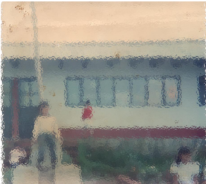
Foto de la escuela en el año de 1991

realizan dentro del plantel. La mayoría de ellos estudió la educación básica y otros pocos no culminaron la educación primaria. La población masculina se dedica a las labores del campo, a la construcción, son peones en los ranchos que hay cercanos a la comunidad y otros pocos, tienen comercios pequeños. Las mujeres en su mayoría son amas de casa y solo algunas trabajan, haciendo labores de limpieza. Según la clasificación que hace la Real Academia de la Lengua Española, acerca de la familia; la mayoría de éstas son nucleares, en donde el padre de familia sale a trabajar y la mamá es la responsable de la educación de sus hijos en la escuela. Después le siguen las monoparentales, estando al frente de ellas las mamás solteras.