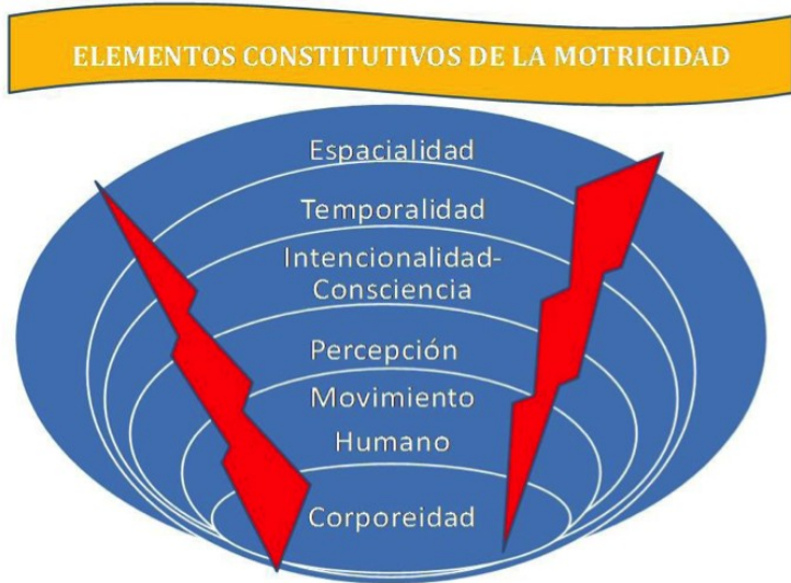
Figura 1. Elementos Constitutivos de la Motricidad

En síntesis, la temporalidad aporta a la comprensión de la motricidad la necesidad de considerar la especificidad de las subjetividades de las experiencias lo cual permite entender que la motricidad configura lo social, es decir, en tanto el tiempo es una construcción social, no está sobre-determinado; por lo cual la motricidad expresa una dimensión temporal de lo social.