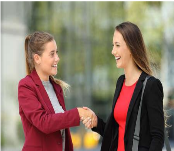
3 de febrero 2018. Vista lateral de dos ejecutivos felices reunión y apretón de manos en la calle.