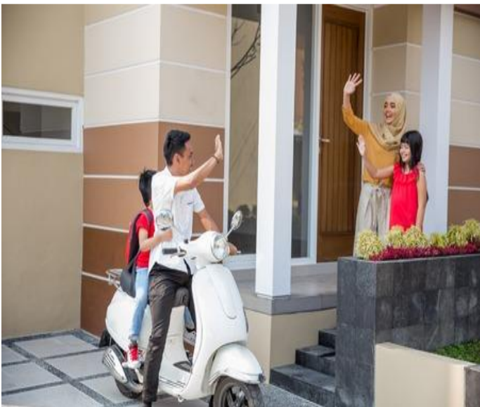
19 de agosto 2019. father and son riding scooter to school