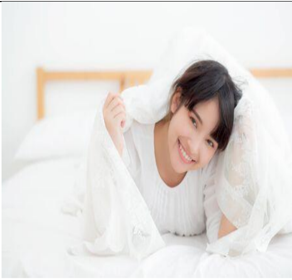
6 de marzo 2015. Beautiful portrait young asian woman lying and smile while wake up with sunrise at morning, girl with happy and fun in the bedroom, lifestyle and relax concept.