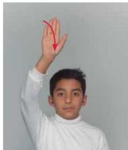
María Ester Serafín de Fleshmann. 2011. Diccionario de lengua de señas mexicana. Saludar. pág. 197