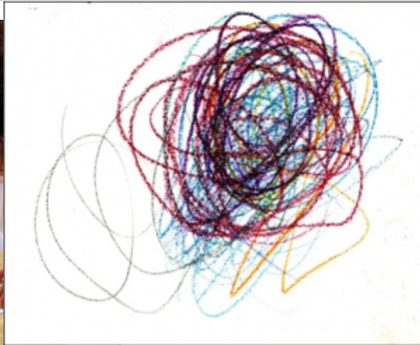
Figs. 1 y 2. Una niña garabateando. Garabato de un niño de 2;04

Pero, mientras el garabateo, por tratarse de una acción, acaba con el propio acto, el garabato perdura sobre el papel como testimonio de ese acto, de ese momento y de sus movimientos y acciones. Y si bien es cierto que la actividad motriz propia del garabateo, en tanto ejercicio muscular (acción "en vacío"), puede constituir al tiempo, su propio objeto y su efecto, el garabato propiamente dicho es, a la postre, el factor fundamental y determinante de la expresión gráfica.