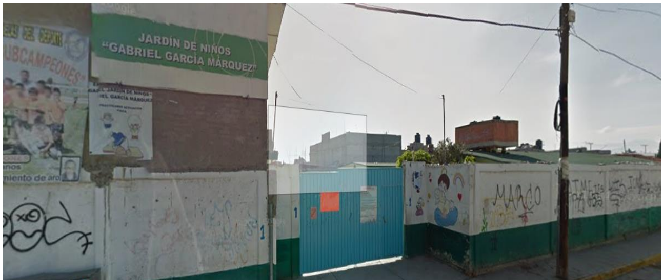
Fachada del preescolar “Gabriel García Márquez”

El jardín de niños arriba mencionado cuenta con cinco grupos: 1° A, 2° A, 2° B, 3° A y 3° B es un turno vespertino de nueva creación que comparte el espacio con el matutino quien atiende preferentemente a la población de las calles cercanas a pesar de que la mayoría de las docentes laboran en doble turno y tienen multifunciones, por las comisiones que les asigna la supervisión escolar, lo realizan muy bien y atienden a una población de 137 niños: 20 en 1°, 48 en 2° y 69 en 3° grado (de acuerdo a la última estadística reportada ante supervisión escolar).