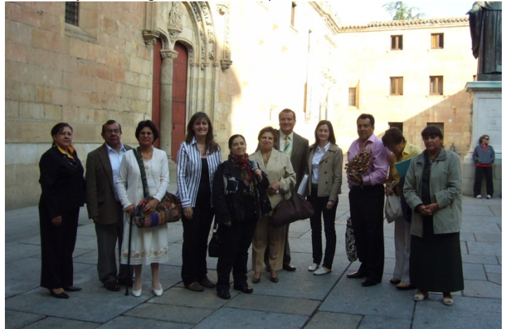
11 de junio, nos dirigimos a las antiguas caballerizas de la Universidad de Salamanca, actualmente convertida en cafetería, para degustar una cena formal.