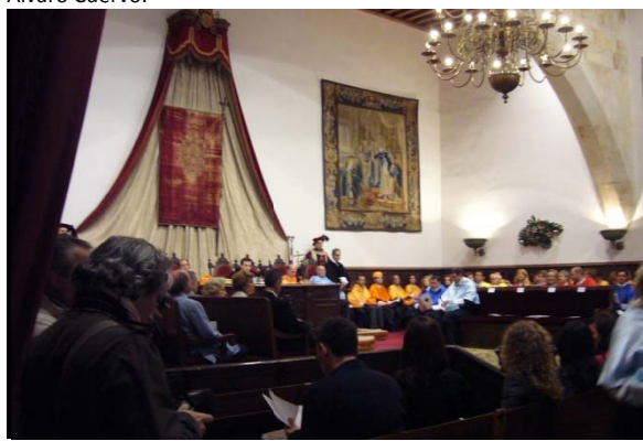
El Paraninfo lleno de color según usanzas antiguas, que exigen el uso del latín como idioma de la ceremonia