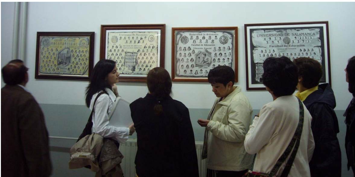
Visita a la Facultad de Educación de la Universidad de Salamanca, cuyas paredes se encuentran decoradas con cuadros de las generaciones de profesores graduados