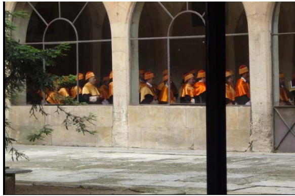
El color identifica las cátedras: azul celeste para Letras, azul turquí para Ciencias, rojo para Derecho, amarillo para Medicina, púrpura para Teología, morado para Farmacia, naranja para Ciencias Sociales y Económicas, verde para Ciencias Ambientales, castaño para Ingeniería, rosa para Psicología y blanco para Bellas Artes