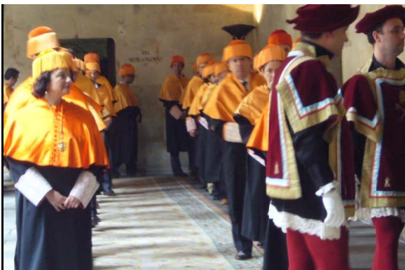
Los rituales, indumentaria e instrumentos se han usado con pocos cambios desde el Medioevo