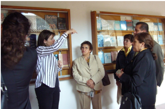
13 de junio, visita a las instalaciones de la Facultad de Educación y al Instituto Universitario de Ciencias de la Educación.