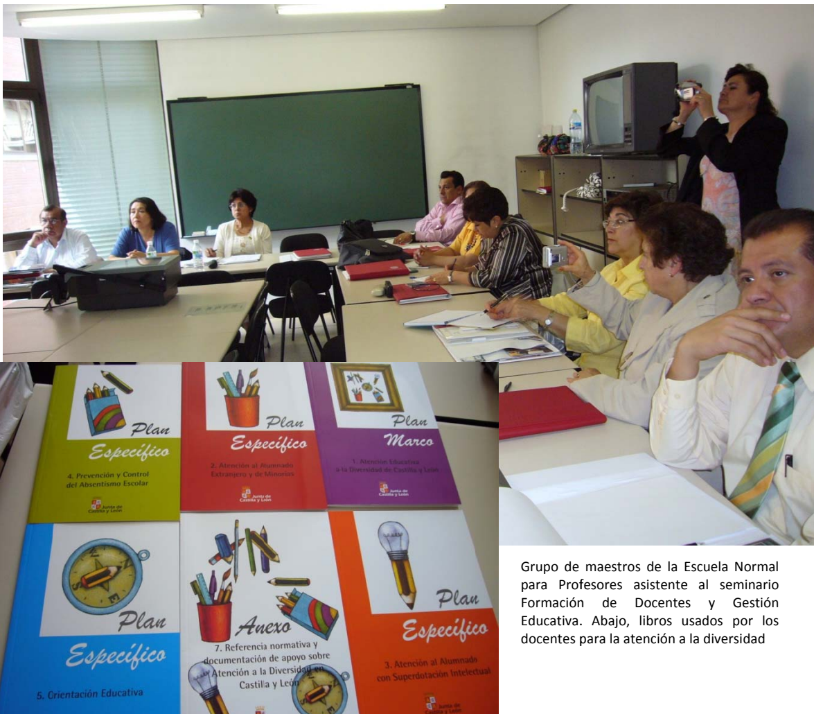
Grupo de maestros de la Escuela Normal para Profesores asistente al seminario Formación de Docentes y Gestión Educativa. Abajo, libros usados por los docentes para la atención a la diversidad

Por lo tanto, las competencias básicas ofrecen una nueva posibilidad para hacer de las escuelas, instituciones inclusivas que promuevan en los niños y en las niñas el desarrollo físico y psicomotor, el desarrollo cognitivo y el desarrollo emocional, atendiendo de manera gradual y progresivamente al movimiento y los hábitos de control corporal, a las manifestaciones de la comunicación y el lenguaje, las pautas elementales de convivencia y relación social, así como al descubrimiento de las características físicas y sociales del medio, facilitando la posibilidad de que los niños construyan una imagen positiva y equilibrada de sí mismos y adquieran cada vez mayores niveles de autonomía personal.