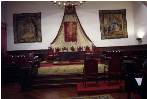
Paraninfo. El Pendón del Infante Don Juan de Aragón, la joya de esta solemne sala, fue obsequiado por los Reyes Católicos Isabel de Castilla y Fernando de Aragón

Tuvimos la oportunidad de presenciar esta ceremonia, que llamó poderosamente nuestra atención por su solemnidad, protocolo y porque el Paraninfo o aula magna es un espacio cuyo mobiliario pertenece a épocas muy antiguas.