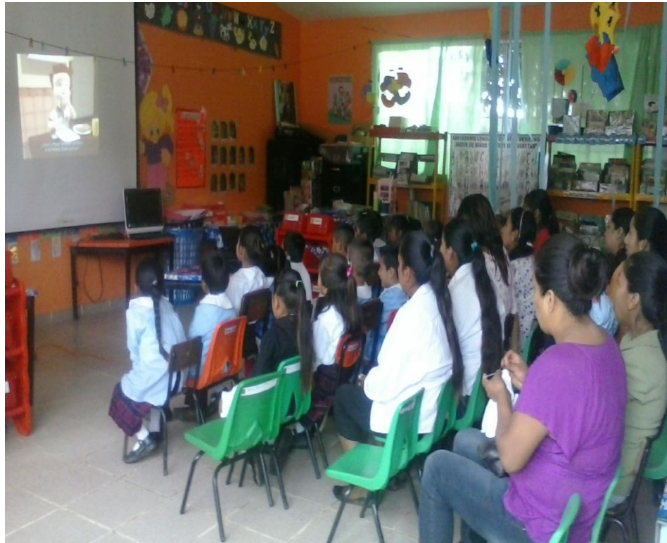
Se realizó la proyección del video "Inclusión"