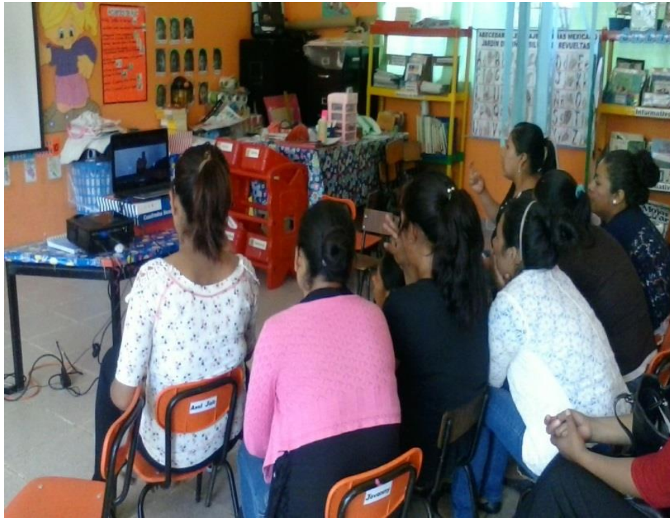
Proyección de video sobre el abecedario en lenguaje de señas