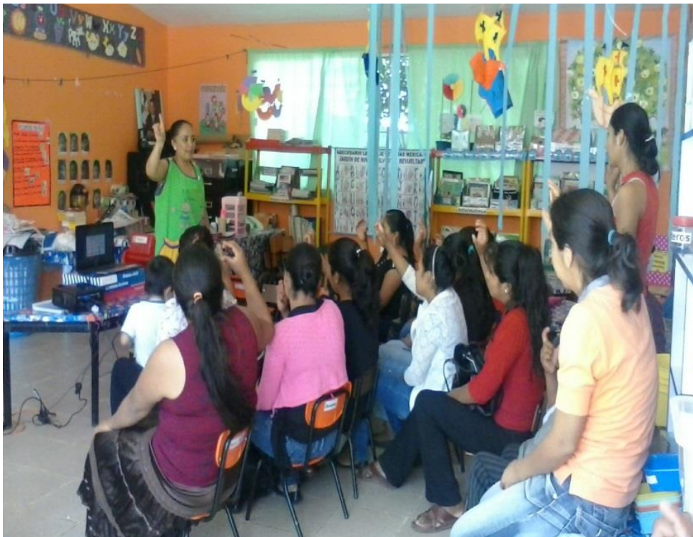
Les enseñó a las mamás la posición correcta de la mano para aprenderse el abecedario.