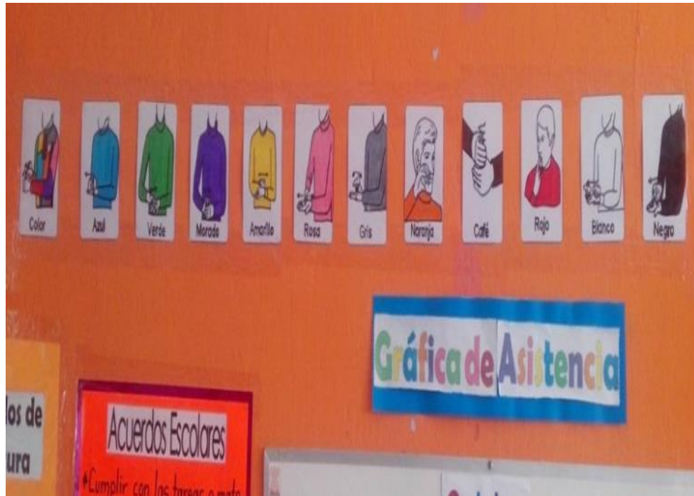
Tarjetas con los colores en lenguaje de señas