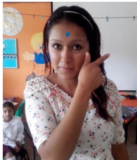
Se bautizó con nombres cortos tanto a los alumnos como a las madres de familia. Por ejemplo una característica relevante del rostro y la letra inicial de su nombre.