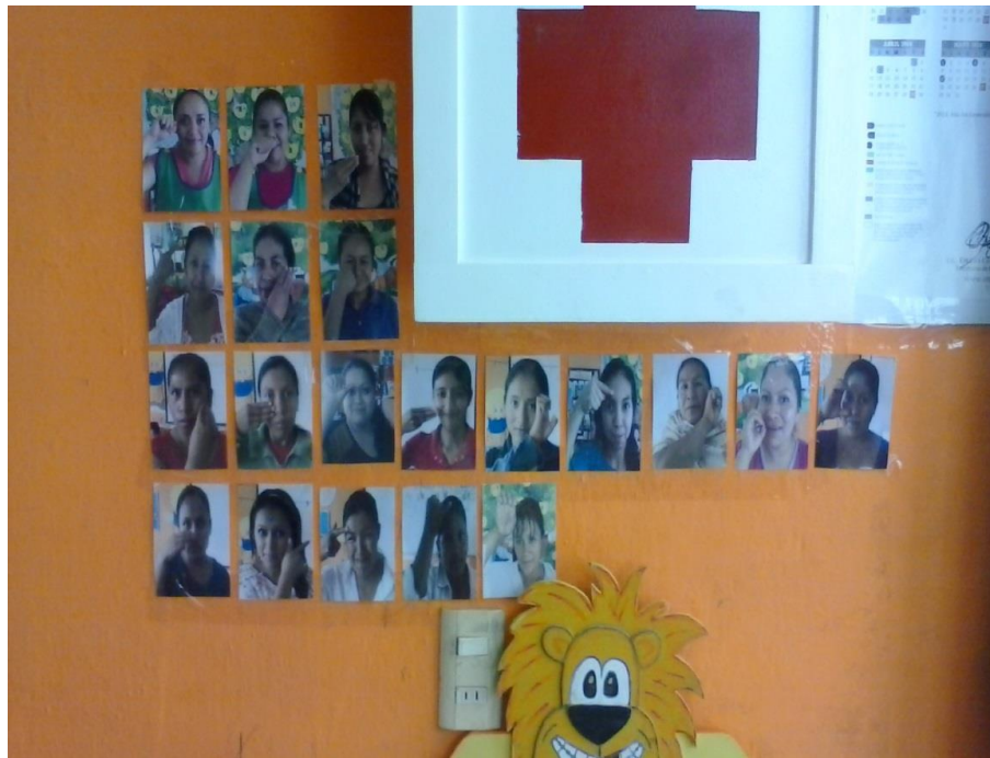
Fotos de las mamás para que la mamá de Ximena también se comunique y relacione con la comunidad escolar.