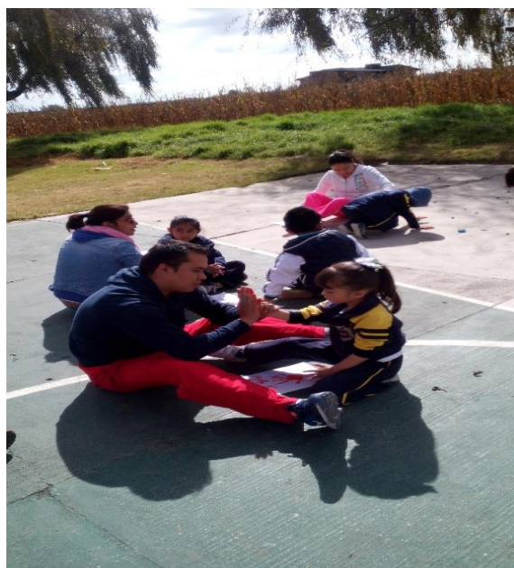
Figura 5. Espacio donde se llevó a cabo la propuesta de intervención “Comprendamos los padres de familia el lenguaje de los niños “

Durante el segundo día el establecimiento de relaciones entre el presente y el pasado a partir del relato de hechos que ocurrieron en la vida actual de los niños y de hechos que ocurrieron en la vida de sus familiares en tiempos diferentes. En el tercer día de trabajo la elaboración de la cueva del hombre de la prehistoria relacionando el presente y el pasado comparando las formas de vida del ser humano, elaboración de pinturas rupestres comparando el arte y las actividades que se realizaban con diferentes instrumentos según cada tiempo y espacio determinado y la comparación de los juguetes e instrumentos que los niños utilizaban en comparación con los del hombre de la prehistoria y como ejemplo más cercano el de sus abuelos.