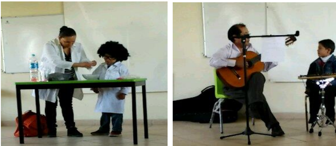
Figura 11. Espacio donde se llevó a cabo la propuesta de intervención “Comprendamos los padres de familia el lenguaje de los niños “

uno que tenía que realizar el día del concurso, llegada la fecha se observó un excelente desempeño por parte de la mayoría de los padres de familia y niños que conformaban el grupo, era evidente que su trabajo había requerido de tiempo para poder ensayar y arreglar cada uno de los detalles, desde elegir el vestuario, la música, los utensilios que se iban a ocupar y los pasos o actos realizados en el escenario.