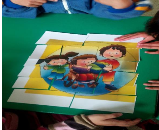
Figura 2. Espacio donde se llevó a cabo la propuesta de intervención “Comprendamos los padres de familia el lenguaje de los niños “

Fuente: Evidencia tomada durante la realización del proyecto “Reconociendo los valores”, Fecha: 27 de mayo del 2015