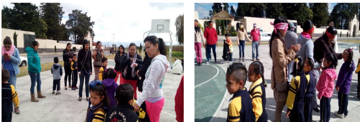
Figura 6. Espacio donde se llevó a cabo la propuesta de intervención “Comprendamos los padres de familia el lenguaje de los niños “

La finalidad de la primera dinámica consistió en el trabajo en equipo para poder liberarse de una tipo red de araña, propiciando el lenguaje tanto en padres como en alumnos, la segunda dinámica trato de la auto confianza y el reconocimiento que los padres tenían de sus hijos, donde los papás tenían los ojos vendados y tenían que reconocer a sus hijos por medio del tacto.