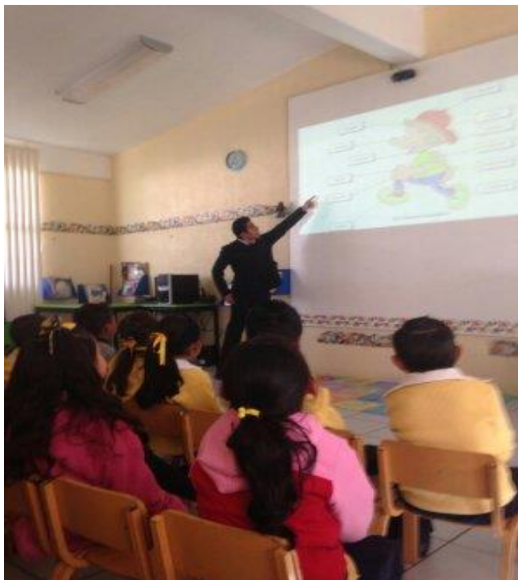
Figura 9. Espacio donde se llevó a cabo la propuesta de intervención “Comprendamos los padres de familia el lenguaje de los niños “

Finalmente proyecto número cuatro “El cuerpo humano” Este proyecto al igual que los anteriores propicio en lenguaje oral entre los alumnos, el docente y los padres de familia, las actividades que se consideraron para atender dicho aspecto fueron las siguientes: contextualización del tema, se rescataron los conocimientos previos a partir de preguntas detonantes, competencia que consistió en identificar las partes del cuerpo humano, en la cual los niños dialogaban acerca de que parte correspondía según lo que les había tocado identificar, analizar y reflexionar sobre las partes del cuerpo humano. Se implementaron adivinanzas para relacionar las partes del cuerpo, exposición de su auto-retrato, aplicación de juegos como la lotería y los rompecabezas y experimentos de lo mismo.