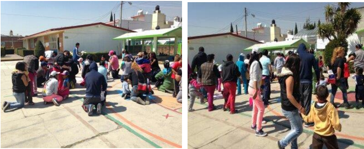
Figura 10. Espacio donde se llevó a cabo la propuesta de intervención “Comprendamos los padres de familia el lenguaje de los niños “

Como actividad detonante se realizó una matrogimnasia con los padres de familia donde se diseñaron actividades que permitieron que los alumnos interactuaran y resolvieran problemáticas con sus padres de familia a través del movimiento físico y el lenguaje oral, al ser los padres de familia los encargados de guiar a sus hijos en las actividades establecidas.