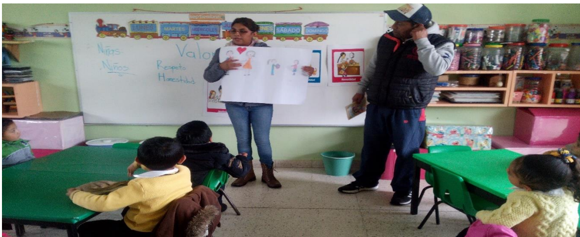
Figura 3. Espacio donde se llevó a cabo la propuesta de intervención “Comprendamos los padres de familia el lenguaje de los niños “

Como actividad fundamental y detonante fue la participación de los padres de familia en la lectura de cuentos acerca de los valores, que permitieron que los niños reflexionaran con ayuda de las diversas historias y situaciones que relataban los padres de familia, además de que esto provocó un estímulo en los niños al ser los papás los encargados de conducir la lectura del cuento.