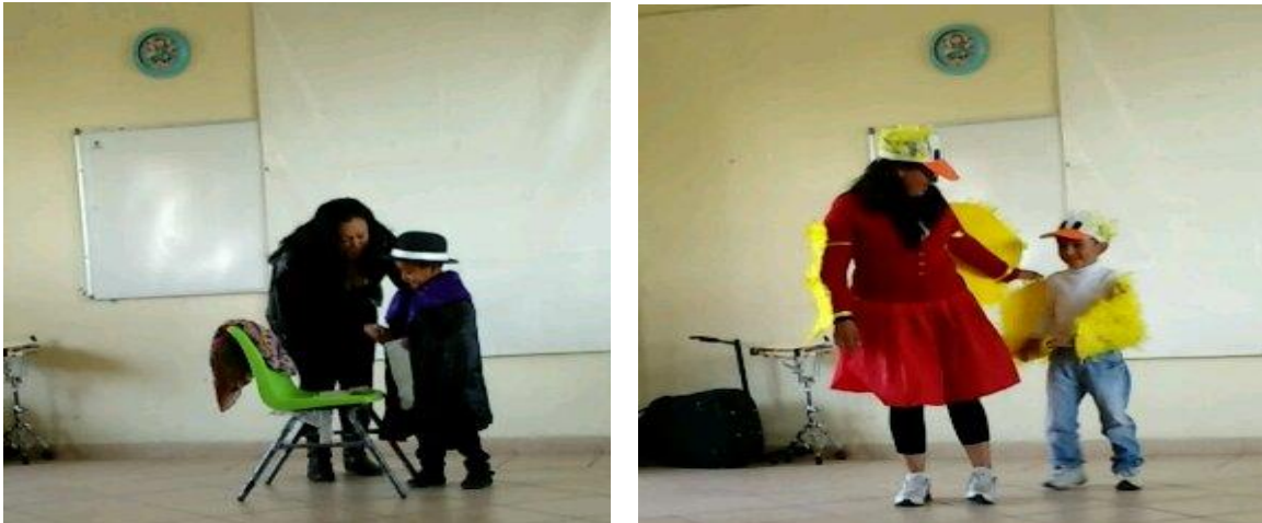
Figura 12. Espacio donde se llevó a cabo la propuesta de intervención “Comprendamos los padres de familia el lenguaje de los niños “