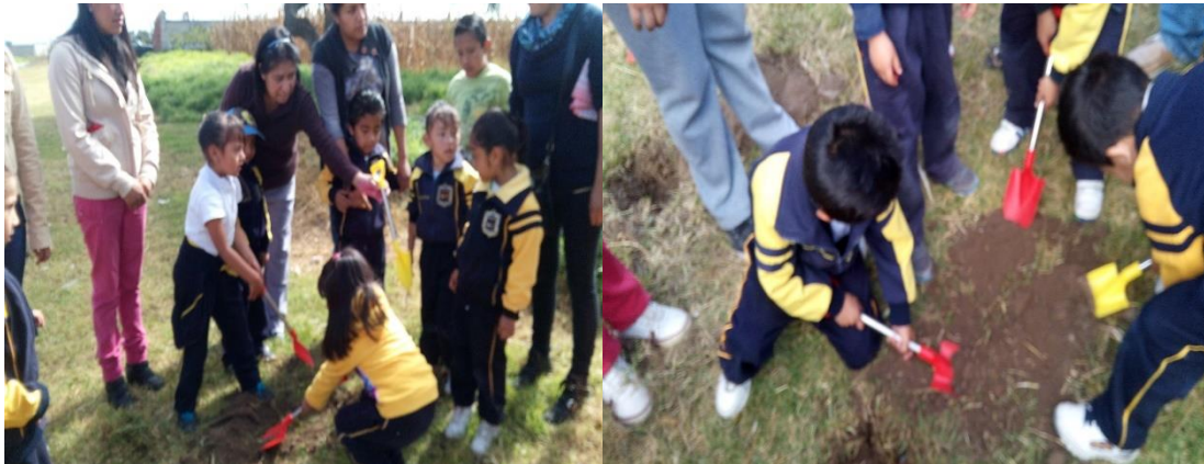
Figura 7. Espacio donde se llevó a cabo la propuesta de intervención “Comprendamos los padres de familia el lenguaje de los niños “