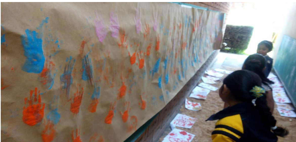
Figura 4. Espacio donde se llevó a cabo la propuesta de intervención “Comprendamos los padres de familia el lenguaje de los niños “

Proyecto número tres “Vamos a viajar a través del tiempo” Durante la implementación de este proyecto se trabajó principalmente con el campo formativo de exploración y conocimiento del mundo en el aspecto de cultura y vida social, en este caso el campo formativo de lenguaje y comunicación se encontraba articulado dentro del proyecto, la articulación principalmente consistió en el diseño de actividades en las cuales se hiciera uso del lenguaje oral, por lo que los alumnos en el transcurso de este proyecto fundamentaron las actividades en la acción y el dialogo, para que a través de la socialización se compartieran y reafirmaran los conocimientos que se estaban transmitiendo. Las actividades que se llevaron a cabo a través del lenguaje oral fueron: toma de acuerdos para el trabajo en el aula, la contextualización de la temática de trabajo, el rescate de los conocimientos previos con los que contaban los alumnos, la participación de los niños a partir de cuestionamientos que se les realizaban durante las actividades, como parte del proyecto la actividad de la búsqueda del tesoro en la cual los alumnos socializaron las pistas y trabajaron en equipo para poder localizar la ubicación del baúl donde se encontraba la historia del hombre de la prehistoria, lluvia de ideas acerca de lo que se pensaba que existió en tiempos pasados.