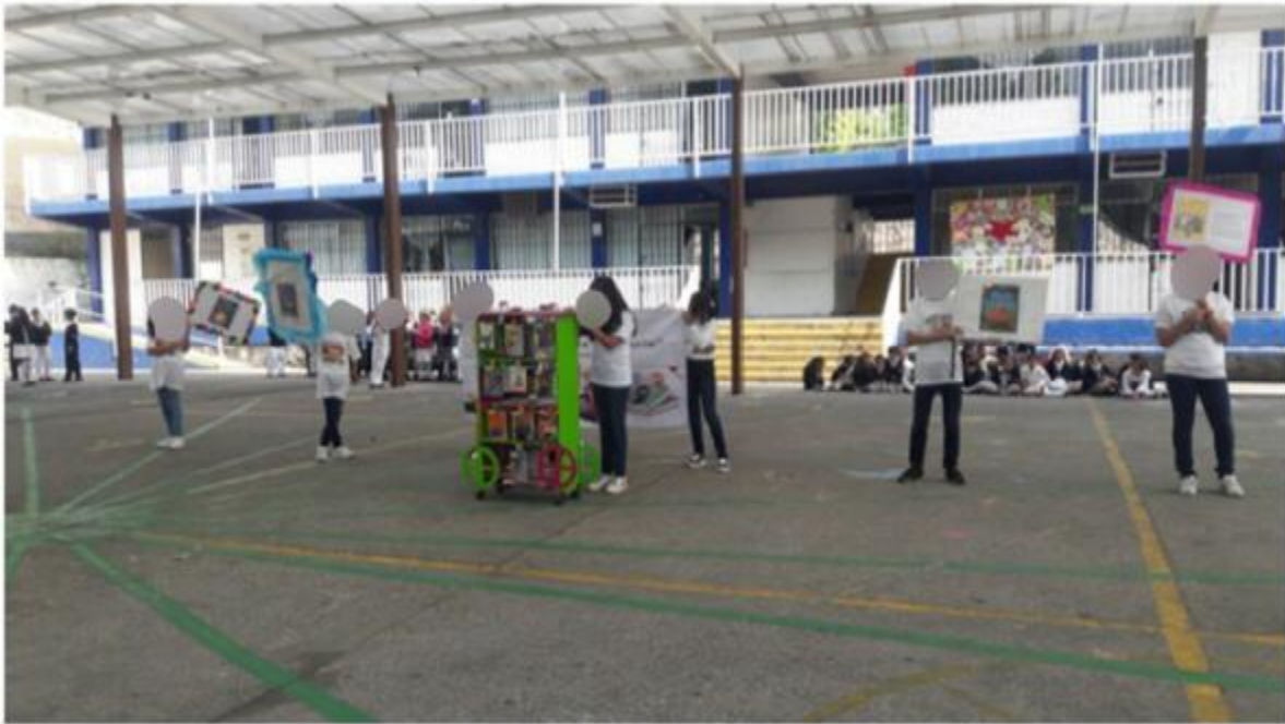
Los alumnos presentaron algunas pancartas haciendo Recomendaciones sobre los libros que les parecieron interesantes.