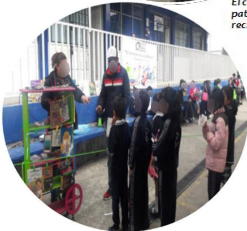
Los padres de familia colaboraron con servicios voluntarios