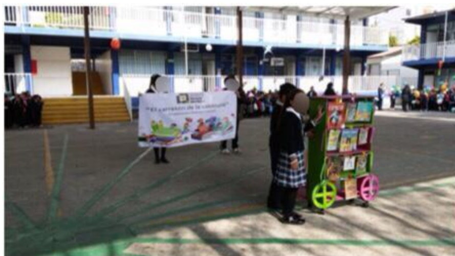
Participación en la inauguración del PNLE.