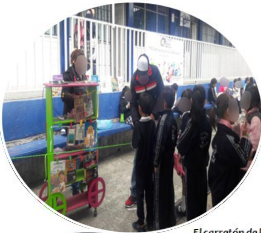
El carretón de la sabiduría en el patio escolar durante los recreos