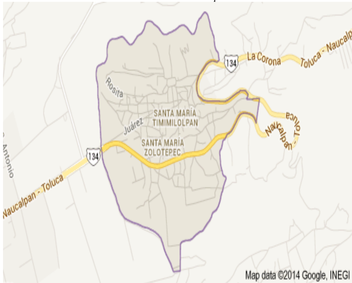
Anexo 1. Plano de la localidad de Santa María Zolotepec.