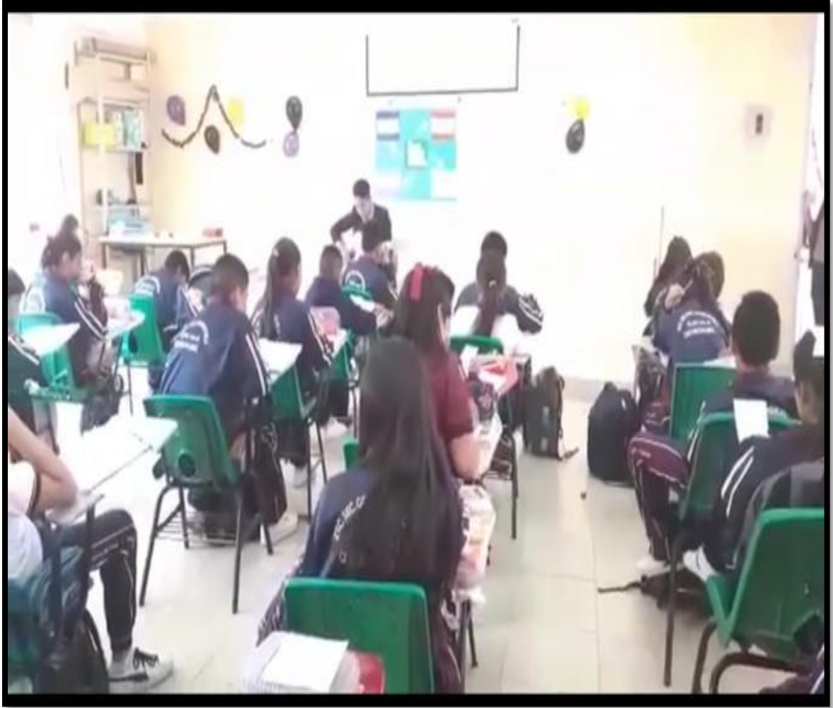
Anexo 5. Fotografía de evidencia del ejercicio 1.