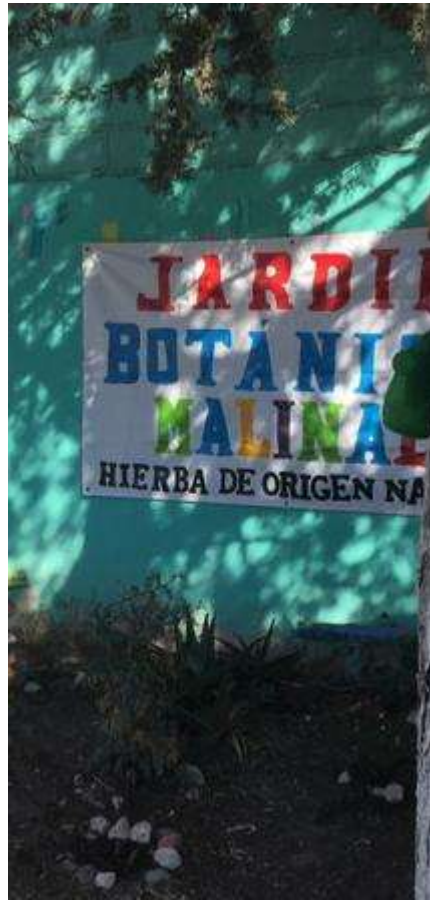
Lona visible con el nombre del jardín botánico