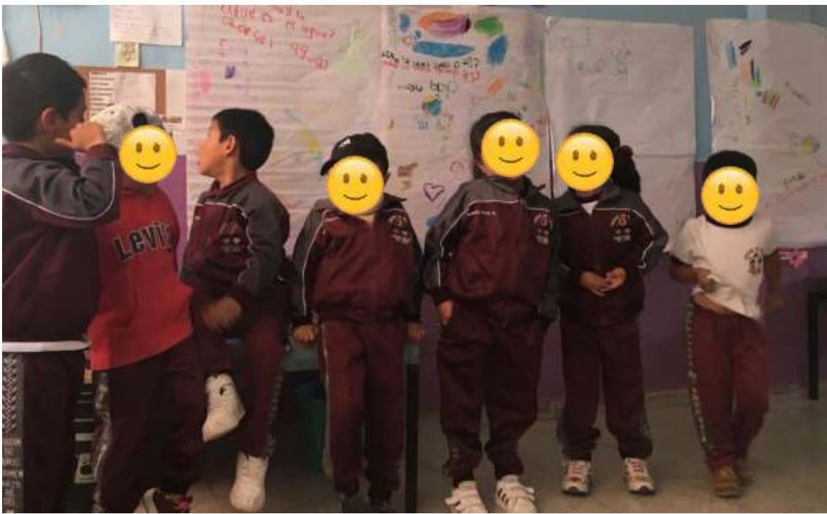
Exposiciones usando su oralidad y procesos de lenguaje escrito