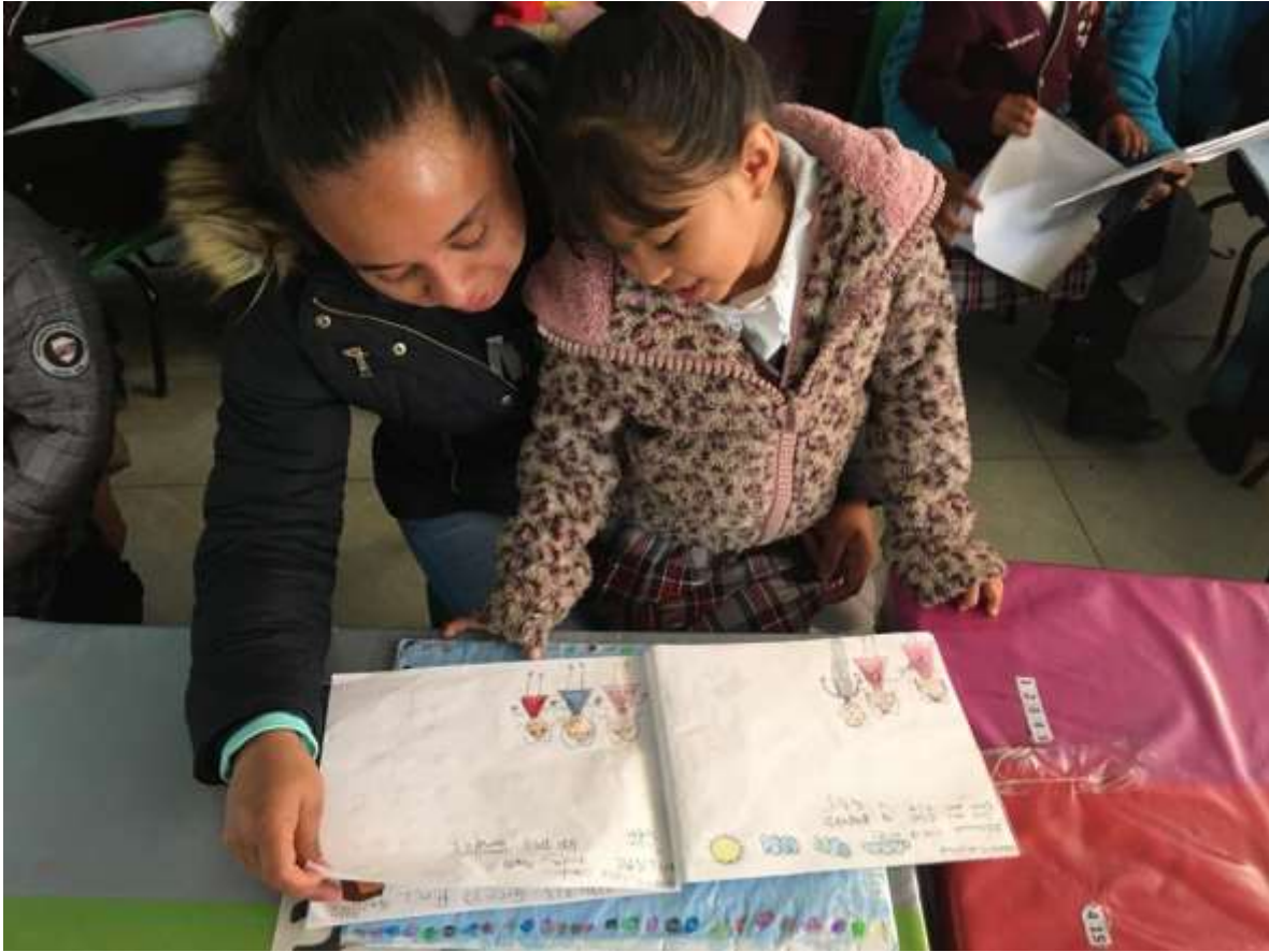
Explicación del texto informativo sobre los tipos de plantas en el jardín botánico