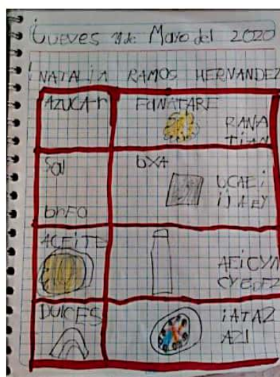
Ilustración 4. Registro de los resultados del experimento de la alumna Natalia.

Después de que hayan descrito su material se propone realizar un cuadro comparativo el cual se muestra en la pantalla para registrar sus ideas iniciales y lo que observan después de realizar el experimento.