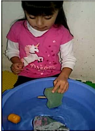
Ilustración 1. Alumna introduciendo objetos al agua.

Después de que escribió sus ideas de lo que cree que pasará con cada objeto, se propone introducir cada uno de los objetos al agua, observar lo que pasa, comprobar si tuvieron razón en sus idea o no y registrarlas en el cuadro de lado derecho.