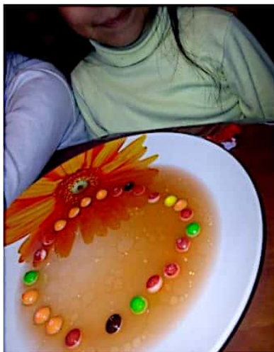
Ilustración 6. Alumna experimentando al agregar agua a los dulces.

De esta forma se realiza con el azúcar y el aceite en otros recipientes de agua. Como ultimo experimento se les pregunta ¿Qué pasa si agregamos agua a los dulces? ¿El agua quedaría igual?. Se registran sus respuestas y se les pide observar primero como se realizara el experimento para lo cual, primero se toma el plato extendido y se colocan los dulces formando un circulo en medio del plato, ya que esté listo se le va agregando agua poco a poco desde el centro, después de que observaron cómo se hace, los niños lo hacen con sus materiales. Por último se les cuestiona: ¿Qué pasó con los dulces? ¿Cambio el agua? ¿Tiene algún color o aroma diferente el agua?