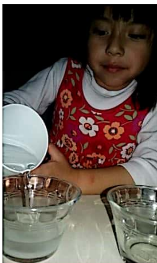
Ilustración 5. Alumna realizando la actividad: agregando agua a los recipientes.

De esta forma se realiza con el azúcar y el aceite en otros recipientes de agua. Como ultimo experimento se les pregunta ¿Qué pasa si agregamos agua a los dulces? ¿El agua quedaría igual?. Se registran sus respuestas y se les pide observar primero como se realizara el experimento para lo cual, primero se toma el plato extendido y se colocan los dulces formando un circulo en medio del plato, ya que esté listo se le va agregando agua poco a poco desde el centro, después de que observaron cómo se hace, los niños lo hacen con sus materiales. Por último se les cuestiona: ¿Qué pasó con los dulces? ¿Cambio el agua? ¿Tiene algún color o aroma diferente el agua?