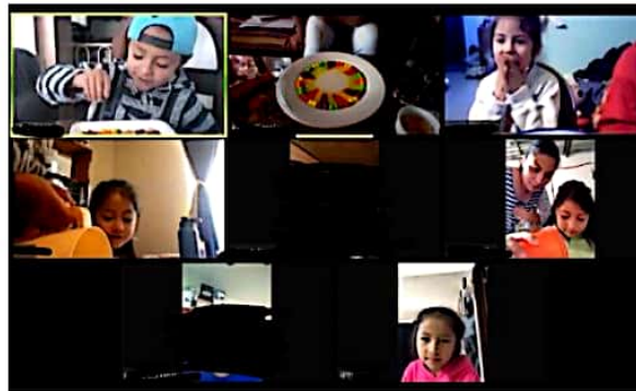
Ilustración 8. Actividad desarrollada en la aplicación de Zoom.

Para concluir se colocan los 4 recipientes y se observa como cambio el agua al agregar diversos materiales y se les plantean algunas pregunta como: ¿El agua se ve diferente en todos los recipientes? ¿Cómo quedo el agua en cada uno de los recipientes? ¿Puedes distinguir que material le agregaron a cada recipiente con agua?