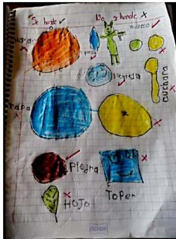
Ilustración 3. Registro de una alumna colocando los objetos que flotan y se hunden.

Al finalizar se da tiempo para realizar hipótesis de los alumnos por medio de preguntas como: ¿Por qué crees que el objeto _____ flotó en el agua y el objeto _____ se hundió? ¿Por qué algunas frutas flotan y otras se hunden?