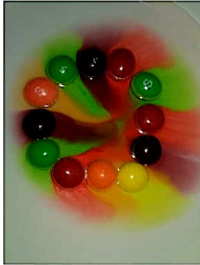
Ilustración 7. Experimento de una alumna con los dulces de colores.

Para concluir se colocan los 4 recipientes y se observa como cambio el agua al agregar diversos materiales y se les plantean algunas pregunta como: ¿El agua se ve diferente en todos los recipientes? ¿Cómo quedo el agua en cada uno de los recipientes? ¿Puedes distinguir que material le agregaron a cada recipiente con agua?