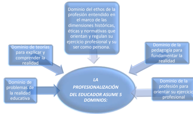
Figura 2. Dominios

quieren continuar aprendiendo, creciendo, compartiendo y formando para ser la diferencia entre otros, a quienes la autocrítica, la reflexión y la innovación les han ayudado a reconocer sus logros y dificultades en la práctica misma.