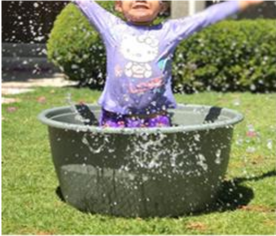
“¿Una forma de divertirse?”