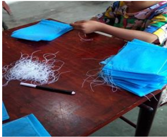
“En casita ¿Yo colaboré en .....?”

Aunado a ello mensajes de los mismos niños: saludando a sus compañeros y maestra, preguntándoles ¿cómo están?, deseándose cosas buenas, esperando un pronto reencuentro nos lleva a hablar de empatía misma que está respaldada por las familias. Quienes creen en el trabajo que se está realizando y que haces múltiples esfuerzos por seguir manteniéndose inmersos en las actividades sugeridas, en comunicación con los otros y sobre todo unidos como grupo.