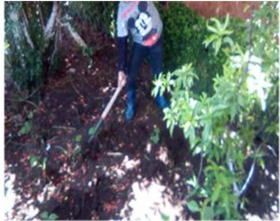
“¿Cuidando la Tierra desde mi Hogar?”