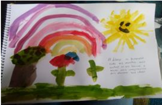
“Crea una obra de Arte y pídele al adulto que te haga un comentario”

Así mismo y sobre el acompañamiento con padres de familia (López B. 2002) se brindan sugerencias para trabajar con sus niños (as), esto en forma de audio cuentos, vídeos y lecturas (todo ello en formatos muy cortos). A la par los propios padres solicitan apoyo sobre diversos temas (¿cómo trabajar berrinches, límites, tiempos de trabajo, etc.). Y sus aportaciones al grupo son realmente muy valiosas, enriquecedoras permitiendo así una orientación para re direccionar hacia donde encaminar los esfuerzos. Como se puede apreciar en las siguientes imágenes: