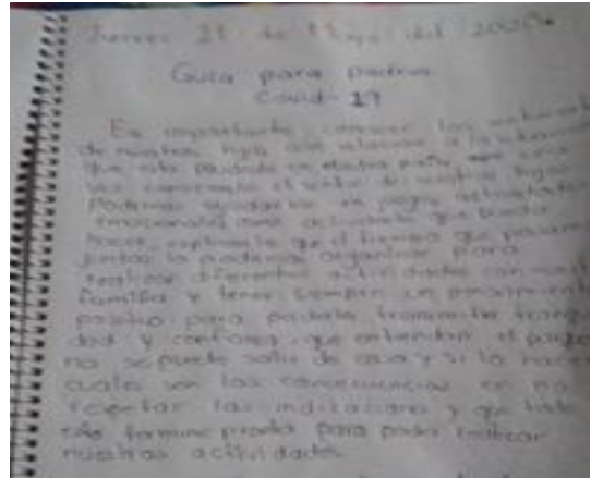
“Compartiendo reflexiones (padres de familia)”