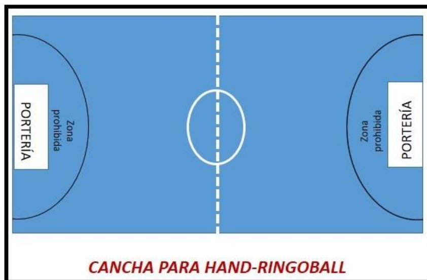
Figura 1. Uso de cancha “Hand-ringoball”