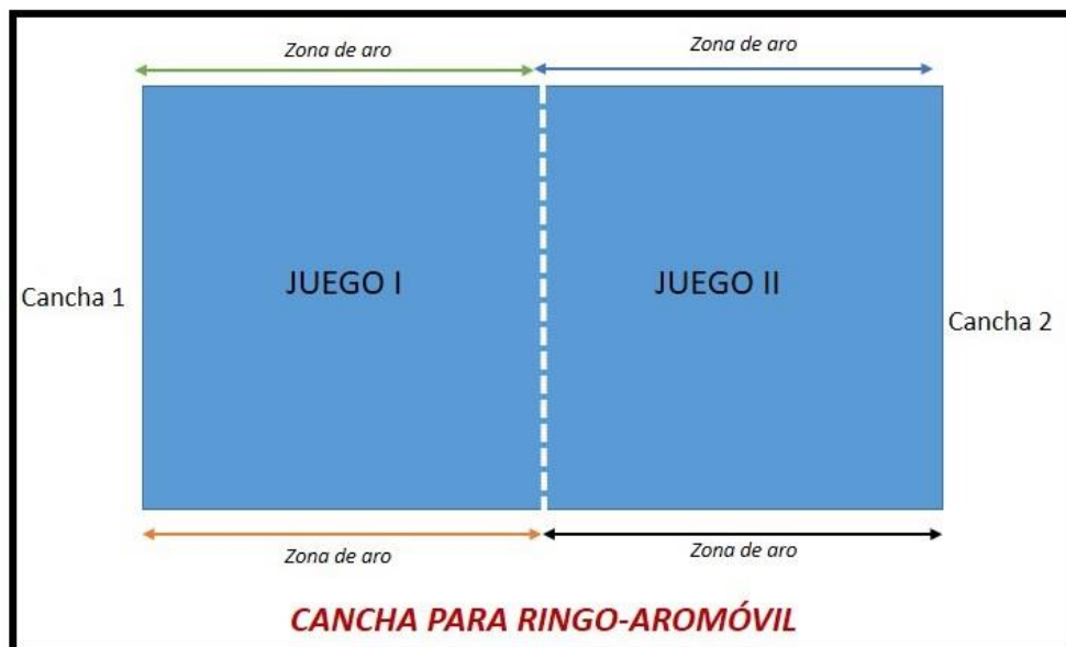
Figura 2. Uso de la cancha “Ringo-aromóvil”

PARTE FINAL: Se valorarán las reglas que se propusieron y se harán los ajustes necesarios para siguientes prácticas.