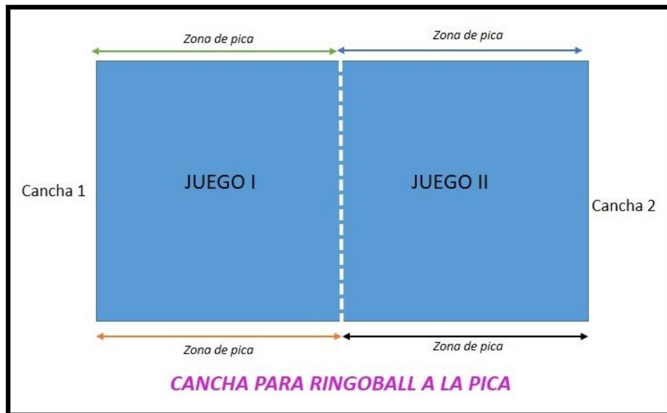
Figura 3. Uso de cancha “ringoball a la pica”.