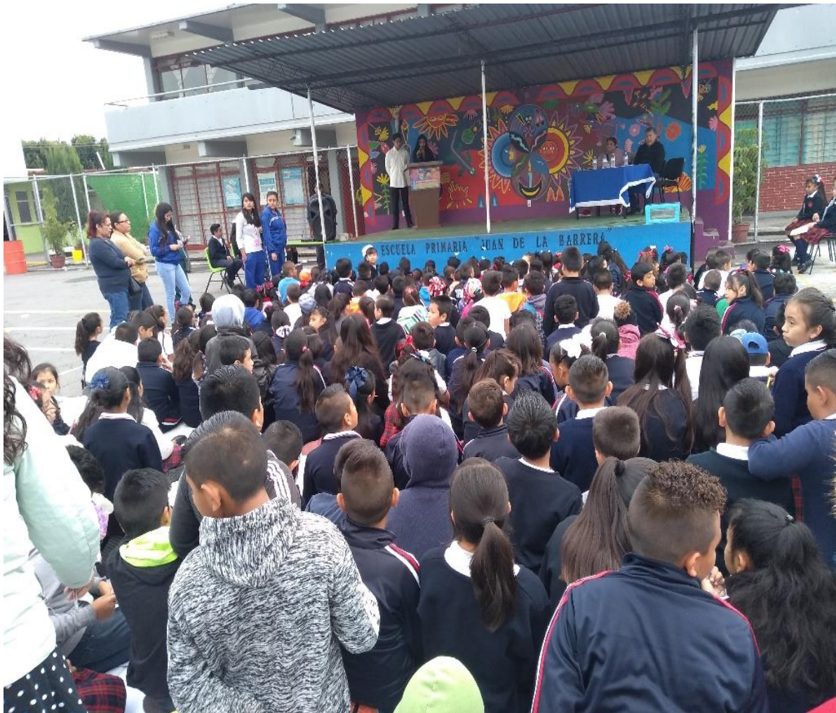
Ilustración 3: En esta imagen podemos observar la presentación de la obra de teatro realizada por los alumnos de 6to b.