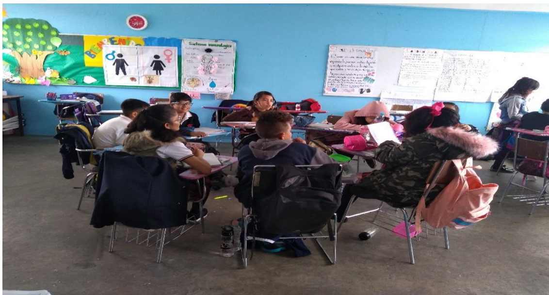
Ilustración 1: Los alumnos dialogan acerca de lo que conocen de los cuentos y obras de teatro así como también cuales conocen.